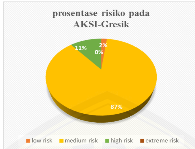
Gambar 3. Prosentase level risiko pada AKSI-Gresik