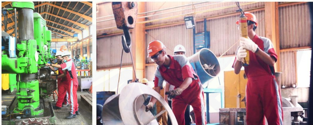
Gambar 2. Praktek mahasiswa pada workshop permesinan 1

Workshop permesinan yang digunakan untuk proses praktikum program studi berbasis teknik mesin ini terdapat pada 2 lokasi yang berdekatan. Salah satu workshop merupakan sharing facility dengan PT Semen Indonesia dalam hal ini divisi perawatan mesin. workshop berukuran 20 m x 15 m ini terdapat berbagai mesin-mesin dengan ukuran yang besar meliputi mesin las, mesin bubut, mesin freis, mesin bending dan hoist crane seperti pada gambar 2. Sedangkan workshop 2 adalah milik AKSI-Gresik yang berisi mesin-mesin sederhana untuk kebutuhan praktek permesinan.