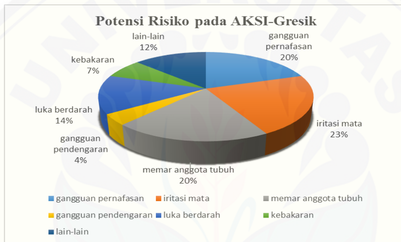
Gambar 4. Potensi risiko pada AKSI-Gresik

Hasil level risk didapatkan pada adanya potensi risiko yang akan terjadi seperti pada gambar 4 dimana 23% potensi tertinggi akan terjadi iritasi mata, 20% gangguan pernafasan dan 20% memar pada anggota tubuh. Iritasi mata dan gangguan pernafasan timbul dari kondisi lingkungan yang masih aktifnya proses manufaktur produk semen walaupun saat ini hanya proses setengah jadi menjadi produk jadi namun efek nya mencapai lebih dari 40%.