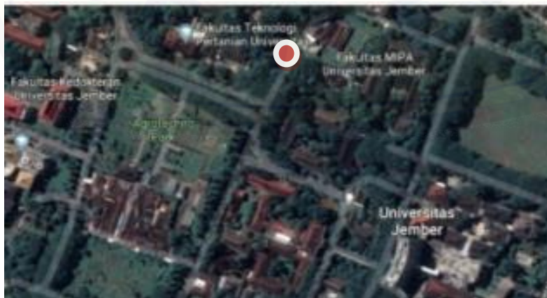
Gambar 1 Lokasi penelitian Proyek IsDB Universitas Jember

Penelitian ini dilakukan pada Gedung Integrated Laboratory for Natural Science and Food Technology . Gedung tersebut berada di Universitas Jember, Jln. Kalimantan No.37, Kabupaten Jember, Jawa Timur. Tepatnya diantara Fakultas MIPA dan Fakultas THP.