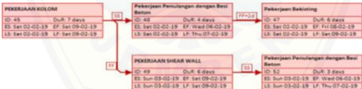
Gambar 5 Jalur kritis pada pekerjaan struktur dengan PDM