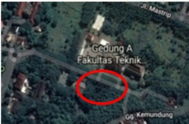
Gambar 1. Lokasi Penelitian Gedung IsDB Engineering Biotechnology

Penelitian ini dilakukan pada Gedung IsDB Project Engineering Biotechnology . Gedung tersebut berada di Universitas Jember, Jln. Kalimantan No.37 Kabupaten Jember, tepatnya di area Fakultas Teknik