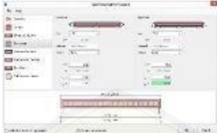
Gambar 1. Pengaturan tulangan utama