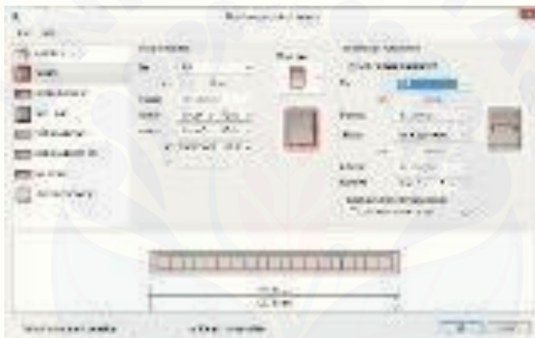
Gambar 2. Pengaturan tulangan sengkang