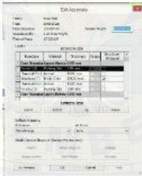
Gambar 5. Pengaturan Elemen Dinding