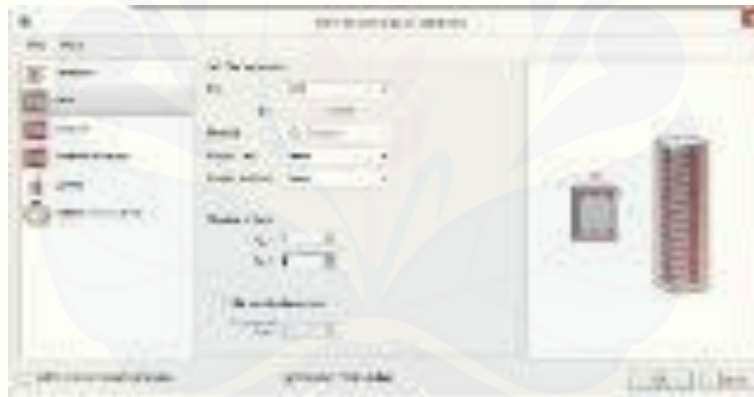
Gambar 3. Pengaturan utama kolom