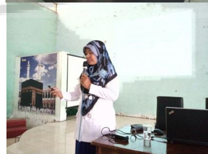
Gambar 3. Penyuluhan Kesehatan Calon Jemaah Haji