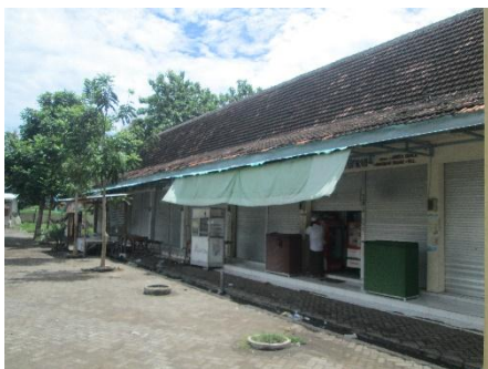
Gambar 1 Lokasi Kios Di Parkir Wisata Religi

Selain itu, penempatan lokasi pedagang yang ada di sekitar parkir wisata religi, sudah di tempatkan di lokasi yang strategis.