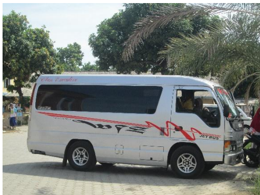
Gambar 2 Travel mini sedang Parkir di depan Masjid

langsung masuk ke area masjid (Wawancara dengan Sekertaris 2).