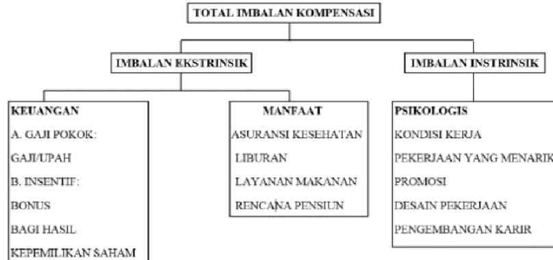
Gambar 1. Dasar Tipologi Kompensasi

Dari Gambar. 1, dapat dilihat bahwa upah/imbalan ekstrinsik merupakan hal yang sama dengan kompensasi langsung mencakup uang kompensasi yang berupa gaji pokok (gaji /upah); insentif (bonus, bagi hasil, opsi saham). Imbalan intrinsik juga sama dengan kompensasi tidak langsung yang meliputi kondisi kerja, pekerjaan yang menarik, promosi, desain pekerjaan, pengembangan karir, dan lain-lain.