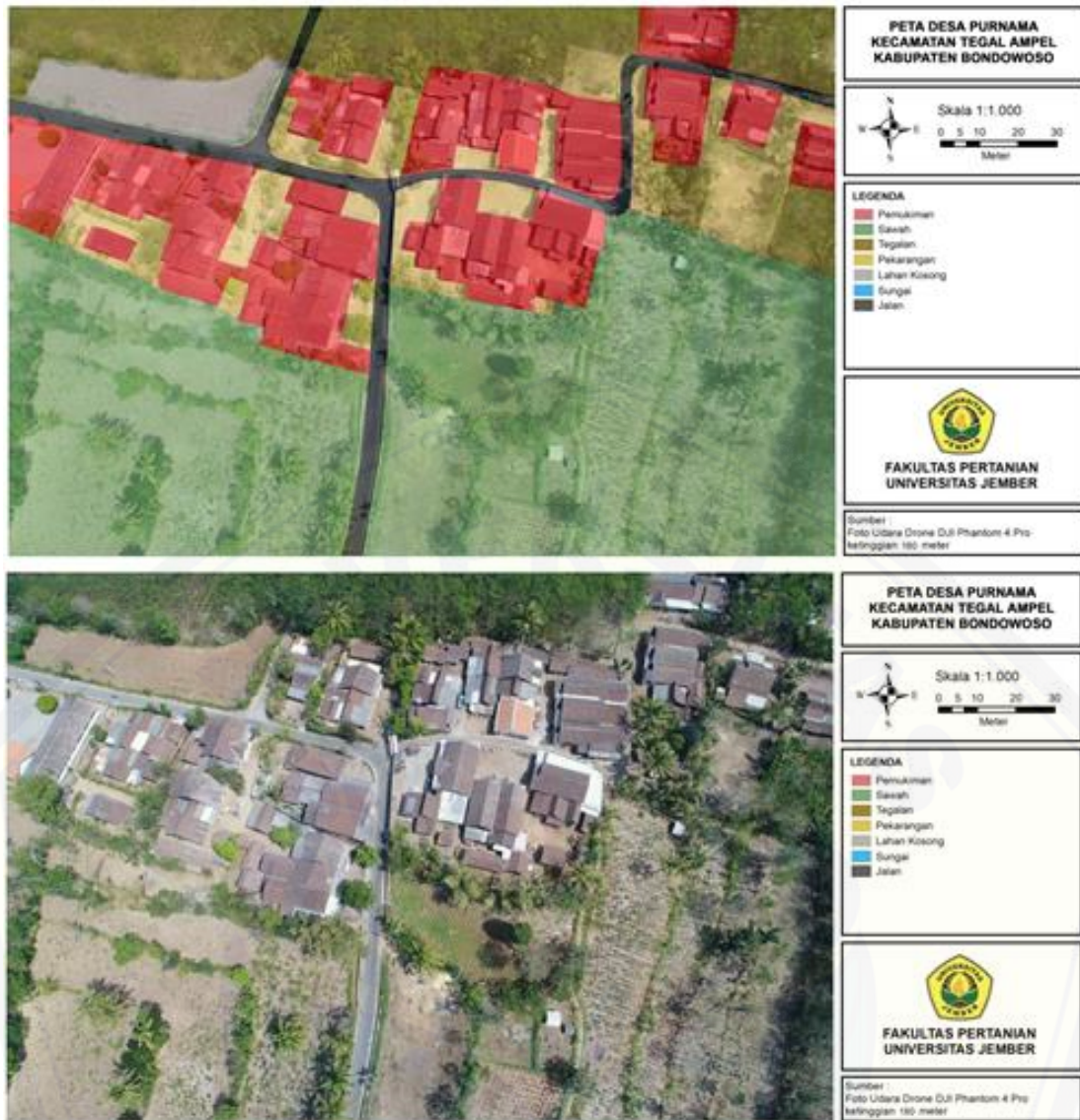
Gambar 2. Hasil Pemetaan Desa Purnama