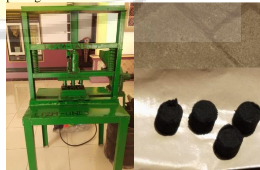
Gambar 5. Pencetakan briket dan produk briketnya

Adonan dimasukkan dalam mesin pencetak briket. Dalam mesin pencetak ada 6 slot untuk adonan, sehingga setiap cetakan menghasilkan 6 briket basah. Hasil cetakan briket ditunjukkan pada gambar 5 dibawah ini.