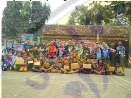
Gambar 1. Kegiatan Karang Taruna di HUT RI

Salah satu kelompok masyarakat yang potensi menjadi motor penggerak kegiatan di desa adalah kelompok pemuda Karang Taruna. Desa Pontang memiliki Karang Taruna dengan nama Karang Taruna Karya Muda. Karang taruna ini merupakan wadah pemuda dengan usia berkisar 18 sampai 30 tahun yang bergerak di bidang sosial yang mendukung terlaksananya program kegiatan desa. Namun demikian, selama ini kegiatan lebih banyak pada kegiatan-kegiatan sosial yang bersifat incidental seperti kerja bakti, sosialisasi program pemerintah, kegiatan peringatan hari Kemerdekaan RI contohnya seperti pada gambar 1.