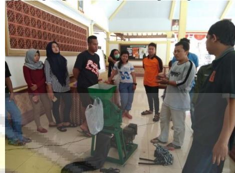
Gambar 3. Pembuatan serbuk arang

Hasil pengarangan kemudian dibuat serbuk sebelum dibuat adonan briket bersama dengan perekat. Pembuatan serbuk menggunakan mesin penggiling seperti ditunjukkan pada gambar 3.