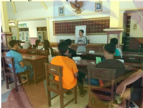
Gambar 2. Penyuluhan potensi limbah pertanian dan pembuatan briket

Penyuluhan meliputi tentang potensi limbah pertanian menjadi material yang bernilai ekonomi seperti potensi menjadi pupuk organik, briket dan asap cair. Kegiatan ini diikuti 13 orang pemuda Karang Taruna, bertempat di balai desa Pontang, kecamatan Ambulu, kabupaten Jember. Materi penyuluhan terlampir. Peserta penyuluhan antusias menyimak kegiatan ini. Kegiatan ini ditutup dengan sesi tanya jawab (Gambar 2).