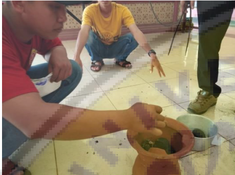
Gambar 6. Uji coba briket menggunakan tungku

Setelah melewati proses pemanasan, briket diuji coba dalam tungku pemanas. Sampel yang diuji coba ini berasal dari bahan tempurung kelapa. Gambar 6 berikut adalah uji coba briket untuk pembakaran.