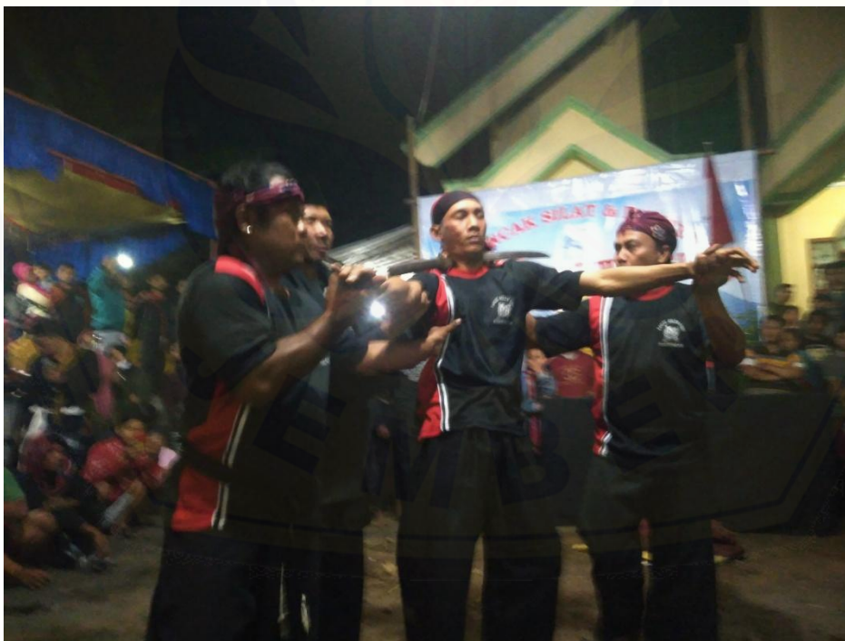
Gambar 6 Pemain saat melakukan atraksi leher ditusuk