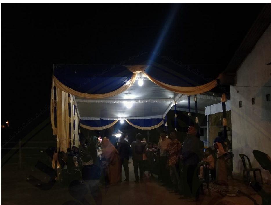
Gambar 7 Rumah penanggap seni Bantengan