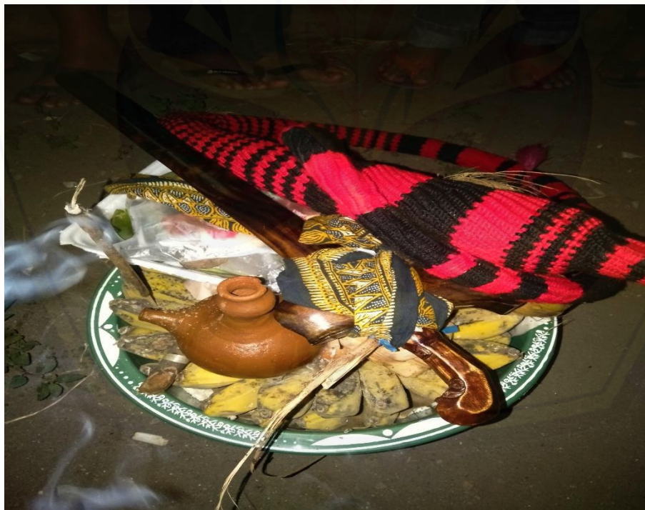
Gambar 4 Sesajen