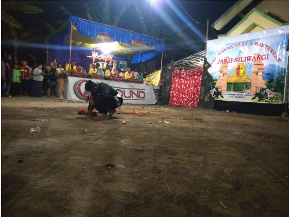
Gambar 5 Pawang melakukan pembacaan doa