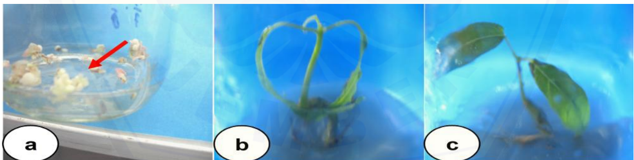
Gambar 1. (a.) Embriosomatik, (b) Plantlet bertunas dan (c). Klon RCC 72 hasil ES yang sudah menjadi plantlet

Tahap Pra Aklimatisasi. Setelah delapan bulan di dalam botol kultur, plantlet dengan tinggi 4-5 cm dan mempunyai satu pasang daun yang berwarna hijau gelap mengkilap (Gambar 1c) dipindahkan ke tahap pra aklimatisasi yaitu tahap sebelum diletakkan di rumah kaca. Plantlet yang ditanam dalam gelas aqua dengan media steril campuran tanah, pupuk kandang dan pasir juga sebagian menggunakan sekam steril, hanya mampu bertahan hidup selama 20 hari. Hal ini kemungkinan disebabkan media pra aklimatisasi terlalu