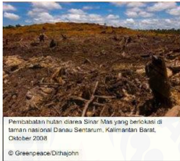
Gambar 3.2 Pembabatan Hutan di Area Taman Nasional Danau Sentarum

sumber-sumber air yang dihasilkan dari sisa penebangan yang dihanyutkan ke hilir (Greenpeace Asia Tenggara, 2008).