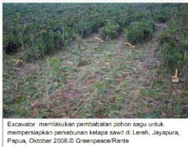
Gambar 3.1 Pembabatan Pohon Sagu untuk Perkebunan Kelapa Sawit

Investigasi yang dilakukan Greenpeace juga menunjukkan bukti adanya pembakaran lahan sebagai bagian dari rencana pembukaan lahan untuk perkebunan kelapa sawit yang dianggap ilegal menurut hukum yang berlaku di Indonesia. Padahal didaerah Lereh tersebut ditumbuhi dengan tanaman sagu beserta nipah yang menjadi kebutuhan utama bagi masyarakat Papua. Sagu sangat bermanfaat sebagai makanan pokok bagi masyarakat Papua sedangkan nipah sering dimanfaatkan sebagai bahan pembuat rumah bagi mereka. Oleh karena itu, perusakan hutan tersebut akan mengakibatkan dampak buruk bagi masyarakat yang menggantungkan hidupnya pada sumberdaya hutan di wilayah tersebut ( Greenpeace Asia Tenggara , 2008).