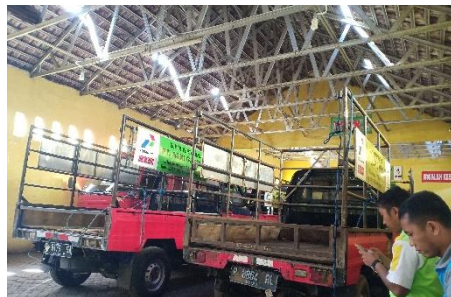
Armada Kendaraan PT. Asri Gasindo