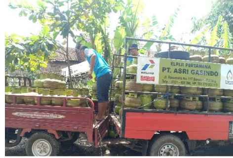
Proses Unloading Tabung Gas Elpiji 3 Kg