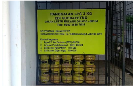
Pangkalan Edi Suprayetno