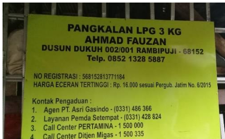
Pangkalan Ahmad Fauzan