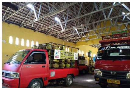
Armada Kendaraan PT. Asri Gasindo