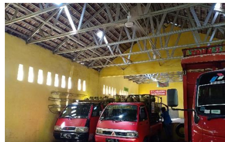
Armada Kendaraan PT. Asri Gasindo