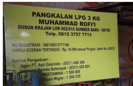
Pangkalan Muhammad Rofi'i