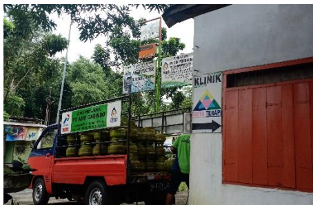
Pangkalan Firjon Sepatagus Wal Habby