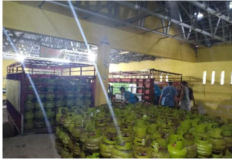
Tabung gas elpiji 3kg PT. Asri Gasindo