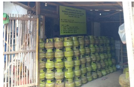
Pangkalan Babun Hasanatul Jannah