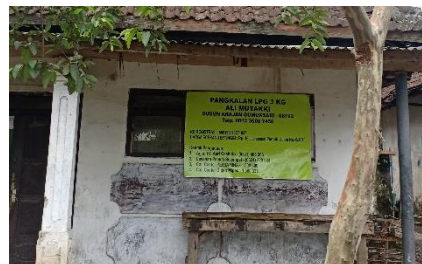
Pangkalan Ali Mutakki