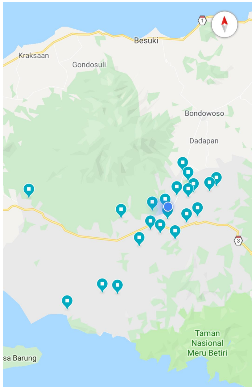
Lampiran 6. Peta Persebaran Pangkalan PT. Asri Gasindo