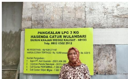
Pangkalan Hasenda Catur Wulandari