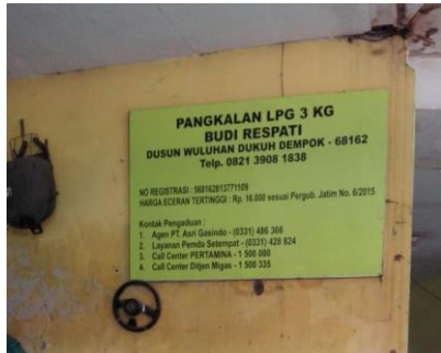
Pangkalan Budi Respati