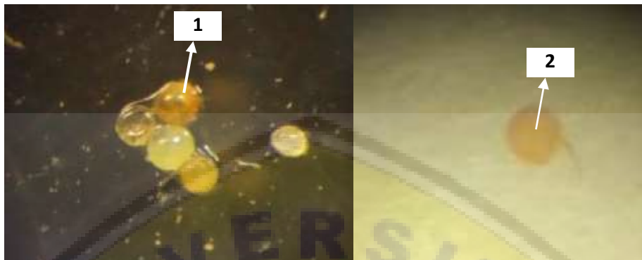
Gambar 1. Spora mikoriza spesies Acouluspora capsicula dan Saccule

Acouluspora capsicula dengan ukuran diameter rata-rata 279 \mu\text{m} . Tampak pada Gambar 1. warna didominasi dengan warna kuning sampai kuning tua dengan beberapa spora yang berakar, dimana menunjukkan spora yang ada sebagian sudah tua dan akan bereproduksi.