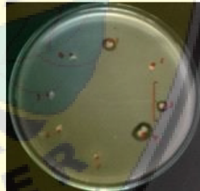
Gambar 1. Zona hambatan Bacillus spp., terhadap Xanthomonas campestris pv. campestris

Berdasarkan hasil isolasi Bacillus didapatkan sebanyak 24 isolat. Hal ini berdasarkan hasil pengujian gram positif dan hipersensitif negatif yang sama ada ke 24 isolat tersebut. Kemudian dilakukan uji penghambatan terhadap Xcc, dan terdapat 12 isolat yang mampu membentuk zona hambatan. Isolat yang mampu membentuk zona hambatan dimasukkan dalam kategori dan pada masing-masing kategori dimbi 2 sebagai perwakilan untuk uji pada tahap selanjutnya (gambar 1).