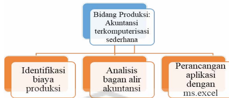
Gambar 1. Solusi di Bidang Produksi