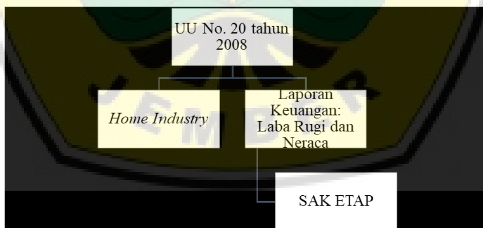
Gambar 2. Kerangka Konseptual

Untuk mempermudah penyusunan dan penyajian laporan keuangan, Ikatan Akuntan Indonesia (IAI) mengeluarkan Standar Akuntansi Keuangan Entitas Tanpa Akuntabilitas Publik (SAK ETAP) yang berlaku secara efektif pada atau setelah 1 Januari 2011. Standar Akuntansi Keuangan Entitas Tanpa Akuntabilitas Publik (SAK ETAP) merupakan pedoman bagi seluruh entitas tanpa akuntabilitas publik termasuk Home Industry dalam menyusun laporan keuangan. Penerapan pencatatan keuangan berdasarkan Standar Akuntansi Keuangan Entitas Tanpa Akuntabilitas Publik (SAK ETAP) pada Home Industry tersebut, yang nantinya akan memberi hasil apakah penerapan pencatatan transaksi keuangan laba rugi berdasarkan Standar Akuntansi Keuangan Entitas Tanpa Akuntabilitas Publik (SAK ETAP) dapat diterapkan dalam Home Industry atau sebaliknya. Berdasarkan uraian tersebut maka kerangka konseptual dapat digambarkan seperti pada Gambar 2.