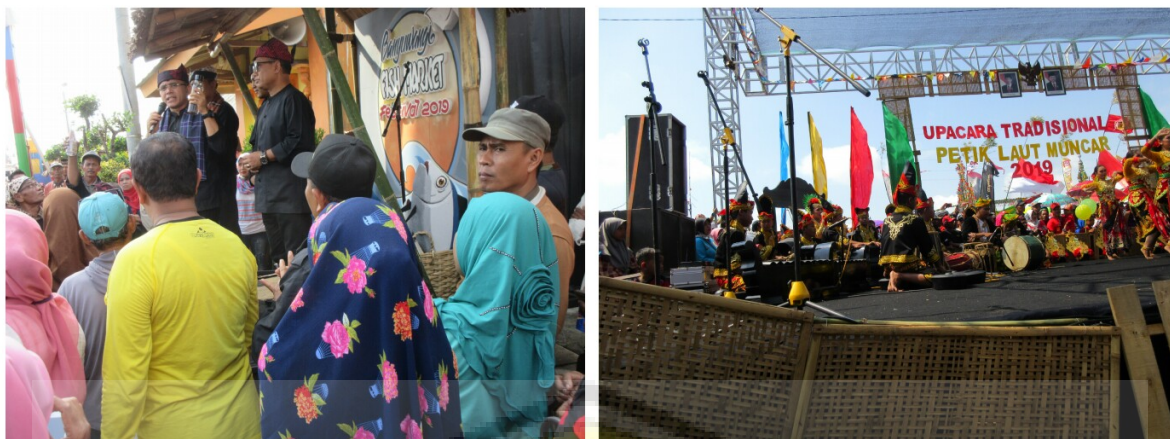
Gambar 2: Bupati Banyuwangi, Abdullah Azwar Anas menunjukkan tumbler untuk bekal minuman yang dapat diisi ulang untuk mengurangi sampah plastik (Kiri). Seni tari tradisional pada pelaksanaan ritual Petik Laut Mncar (Kanan).

Sambutan Bupati dalam acara Fish Market mengedukasi masyarakat nelayan Muncar dan para tamu yang hadir akar membiasakan diri “gemar makan ikan”. Agar ikan berdatangan dan wisatawan juga berdatangan, masyarakat diajak untuk menjaga kebersihan pantai, utamanya dari sampah plastik. Bupati Abdullah Azwar Anas mengajak masyarakat nelayan pada saat melaut membawa bekal minuman dalam tumbler yang dapat diisi ulang. 1 Perjalanan kapal nelayan yang mengiringi gitik sesaji mencapai jumlah 50-an kapal besar yang berisi 50–60 penumpang sedangkan kapal-kapal kecil berisi 10–15 penumpang. Sebagian penumpang yang mengikuti adalah anggota keluarga dari Anak Buah Kapal (ABK) masing-masing.