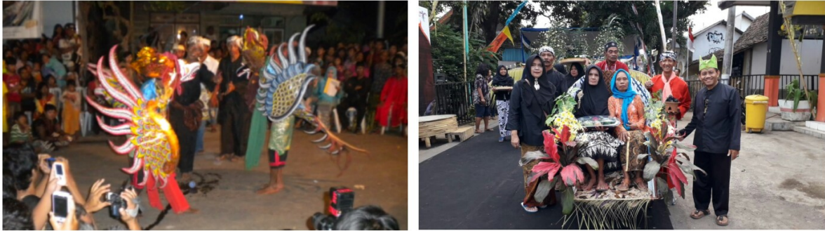
Gambar 1: Sabung ayam digandi ayam-ayaman, tahun 2011 (Kiri). Prosesi ziarah ke makam Buyut Witri penari seblang dan pengudang mengendarai becak (Kanan).

Literasi budaya khususnya ritual memungkinkan masyarakat melakukan inovasi dan kreasi dengan mengambil bagian-bagian yang tidak baku. Di Olehsari, inovasi dilakukan pada pengaturan diversifikasi usaha yang disosialisasikan, dipromosikan, dan dipasarkan pada lingkungan arena seblang. Pada pelaksanaan seblang Bakungan inovasi dan kreasi dilakukan dengan memulai kegiatan pada H-2 atau H-3 yang diisi dengan ekspo produk UMKM lokal Bakungan khususnya dan Banyuwangi pada umumnya. Kegiatan lainnya adalah aneka lomba untuk anak-anak, apresiasi seni berbasis sekolah dan masyarakat. Sedangkan inovasi dan kreasi yang langsung adalah penggunaan narasi 2 (dua) bahasa, yaitu bahasa Indonesia dan bahasa Inggris. Inovasi dan kreasi dilakukan setelah mengadakan observasi sejak tahun 2011 dan mendapatkan persetujuan dari para pelaku ritual seblang Bakungan (ketua adat, pawang, pengudang) dan birokrat setempat (Lurah Baungan), dan budayawan Banyuwangi.