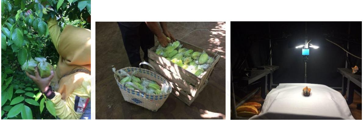
Gambar 1. Pengambilan Sampel Buah Belimbing Manis di Kebun dan Pengambilan Gambar Citra Belimbing Manis di Laboratorium Instrumentasi