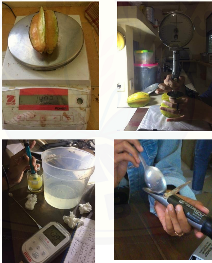
Gambar 2. Pengukuran Variabel Sifat Fisik dan Kimia Belimbing Manis