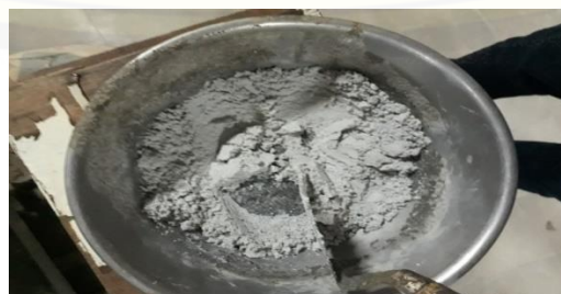
Gambar 2.3 limbah las karbit (fas 0,6)