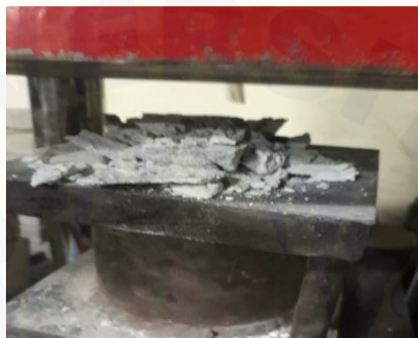
Gambar 2.6 kuat tekan (fas 0,6)

Dari percobaan diatas campuran kadar air (fas) yang tepat adalah 0,4 karena saat dikeluarkan dari cetakan tidak ada retakan dilihat secara fisik, uji kuat tekan mempunyai nilai yaitu 1,19 kN untuk fas 0,5 dan 0,6 tidak memiliki nilai kuat tekan yaitu 0.