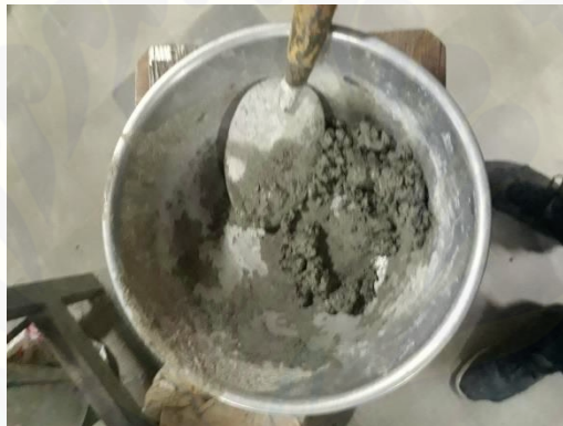
Gambar 2.9 campuran semen dengan limbah las karbit (100%:0%)