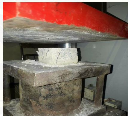
Gambar 2.10 kuat tekan (50%: 50%) Gambar 2.11 kuat tekan (75%:25%)