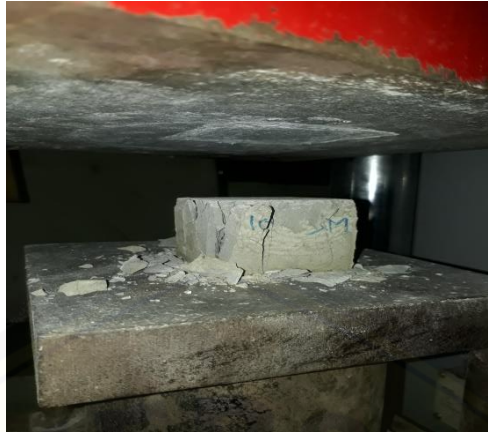
Gambar 2.12 kuat tekan (100%:0%)

Dari percobaan diatas uji kuat tekan yang paling besar yaitu 100% semen 0% limbah las karbit yaitu 71,38 kN dan yang paling kecil adalah 50% semen 50% limbah las karbit 23,11kN.