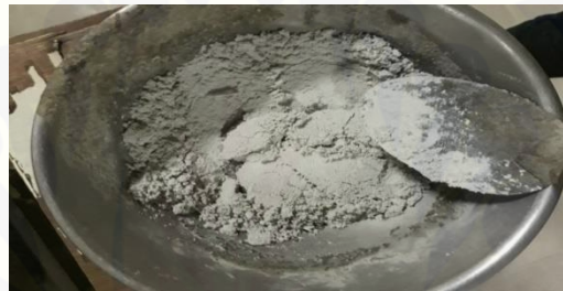
Gambar 2.1 limbah las karbit (fas 0,4)