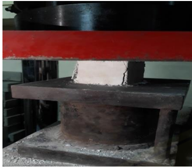
Gambar 2.4 kuat tekan (fas 0,4)