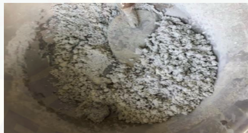
Gambar 2.2 limbah las karbit (fas 0,5)