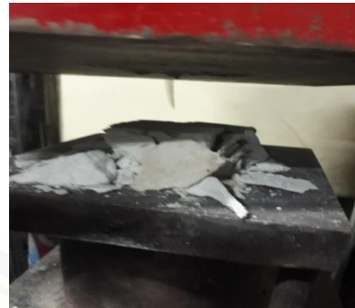
Gambar 2.5 kuat tekan (fas 0,5)