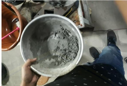
Gambar 2.8 campuran semen dengan limbah las karbit (75%:25%)