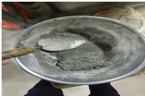
Gambar 2.7 campuran semen dengan limbah las karbit (50%:50%)