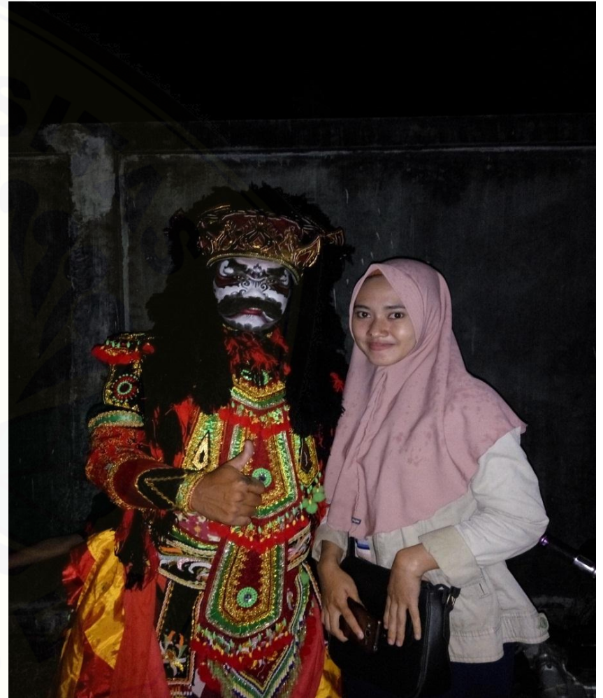
Gambar 12. Salah satu penari jaranan buto