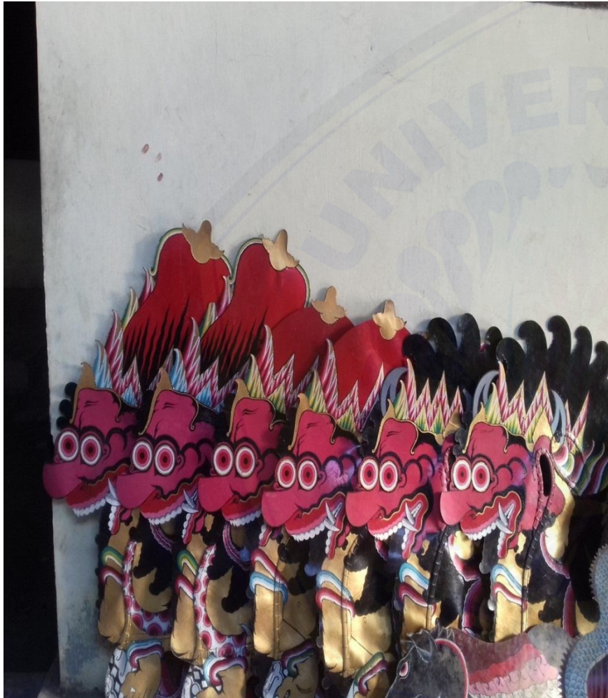
Gambar 11. Tunggangan pemain jaranan buto