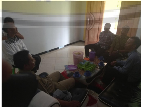
Gambar 3. Kegiatan sosialisasi program kegiatan ke mitra kegiatan