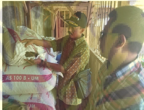
Gambar 8. Kegiatan penerapan program kegiatan di mitra kegiatan