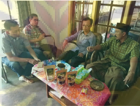
Gambar 2. Kegiatan sosialisasi program kegiatan ke mitra kegiatan