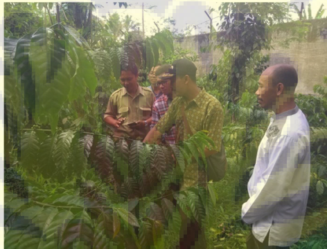
Gambar 5. Kegiatan observasi ke mitra kegiatan