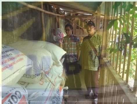
Gambar 9. Kegiatan penerapan program kegiatan di mitra kegiatan