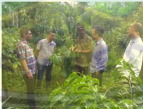
Gambar 6. Kegiatan observasi ke mitra kegiatan