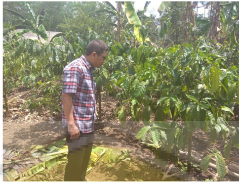
Gambar 4. Kegiatan observasi ke mitra kegiatan