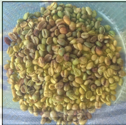
Gambar 11. Kopi pecah kulit hasil kegiatan