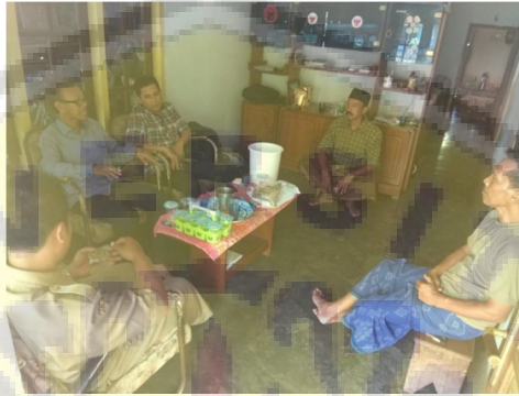
Gambar 1. Kegiatan sosialisasi program kegiatan ke mitra kegiatan