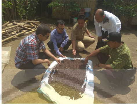
Gambar 7. Kegiatan penerapan program kegiatan di mitra kegiatan