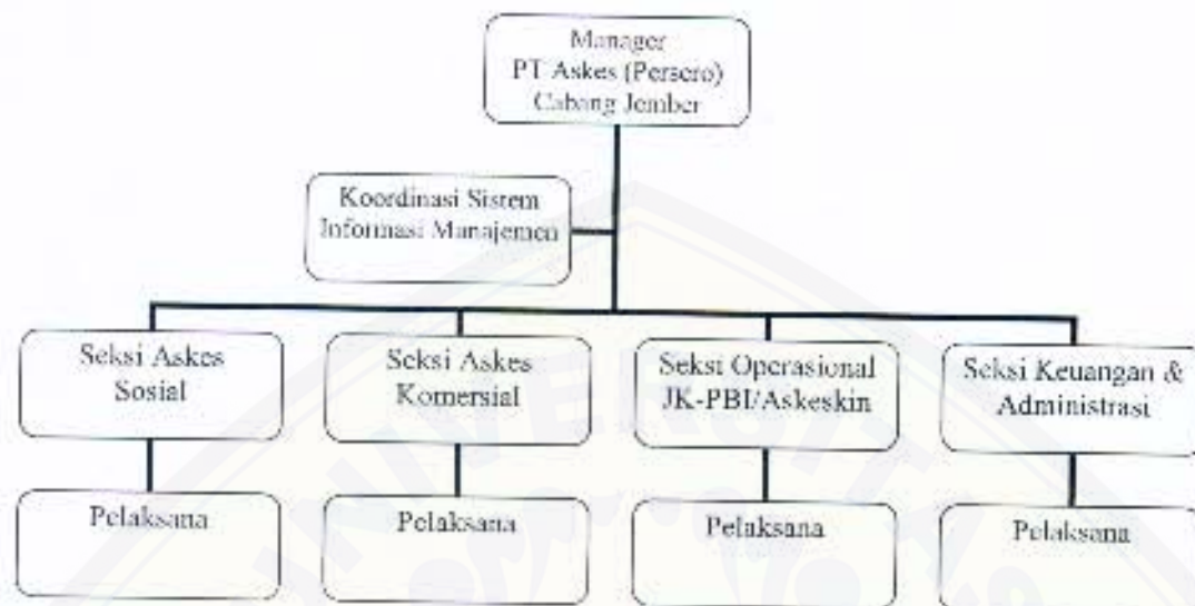
Bagan 3.1 Struktur Organisasi PT. Askes (Persero) Kantor Cabang Jember