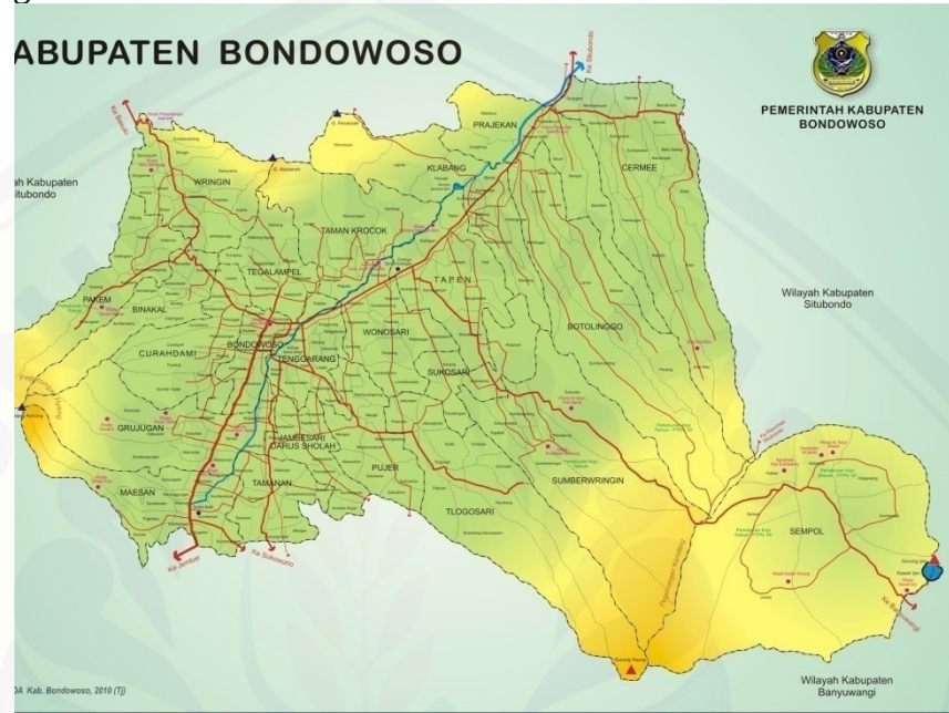
Gambar 1.1 Peta Lokasi Kabupaten Bondowoso

meningkatkan perekonomian dan pembangunan daerah Kabupaten Bondowoso di dukung oleh beberapa sektor seperti Industri , Perdagangan dll. Untuk mengurangi kesenjangan antar wilayah serta untuk meningkatkan Potensi daerah dan juga pertumbuhan ekonomi perlu dilakukan dukungan terhadap sektor-sektor unggulan untuk terus dapat meningkat sumbangsinya dalam mendukung perekonomian Kabupaten Bondowoso. Gambaran letak lokasi kabupaten Bondowoso dapat dilihat dalam gambar 1.1 .