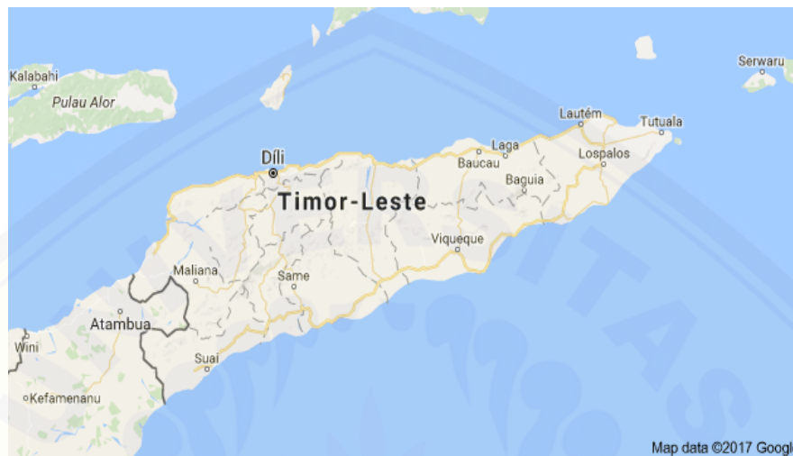
Gambar 3.1 Peta Timor Leste 2

Democrática de Timor Leste . Luas wilayah Timor Leste sebesar 15.410 km 2 . Dengan luas wilayah tersebut, Timor Leste memiliki jumlah penduduk sebanyak 1,12 juta jiwa dengan kepadatan 78 penduduk/km 2 dan pertumbuhan penduduk sebesar 2,4% 1 .