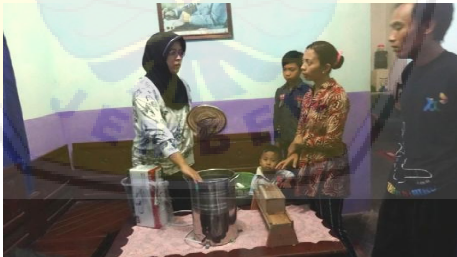
Gambar 1. Kegiatan Adaptasi Peralatan

ini bertujuan untuk memastikan bahwa seluruh kegiatan dapat diterima dengan baik oleh mitra. Dengan adanya kegiatan pengabdian ini, mitra menjadi memiliki wawasan yang lebih luas mengenai cara pembuatan keripik singkong aneka rasa sekaligus memanfaatkan limbahnya, yaitu kulit singkong. Limbah tersebut diolah sedemikian rupa, sehingga dapat dikonsumsi dalam bentuk keripik kulit singkong aneka rasa. Diharapkan dengan dihasilkan produk yang berkualitas, rasanya enak disertai dengan beberapa pilihan rasa, dikemas menarik, dan masasimpannya lama, dapat membantu memperluas pemasaran produk tersebut dan meningkatkan pendapatan mitra bahkan masyarakat sekitarnya. Dari hasil monitoring dan evaluasi pelaksanaan kegiatan, diketahui bahwa dengan adanya bantuan peralatan dan meningkatnya pengetahuan mitra tentang pengolahan singkong dan kulitnya menjadi keripik, kapasitas produksinya meningkat dan penjualannya juga cukup baik. Hal ini juga didukung oleh kualitas produk yang meningkat disertai pengemasan yang baik. Dengan demikian diharapkan omzet penjualan meningkat, sehingga kesejahteraan mitra meningkat pula.