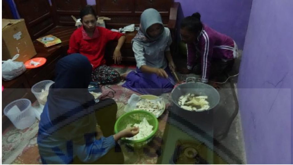
Gambar2.Kegiatan Pelatihan Produksi Keripik