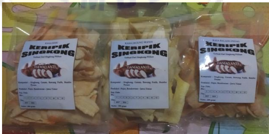
Gambar4.Produk Keripik Singkong