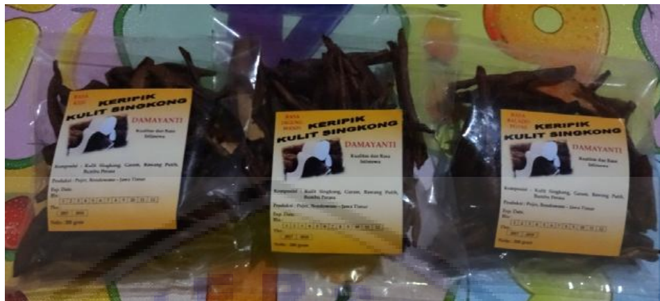
Gambar5. Produk Keripik Kulit Singkong