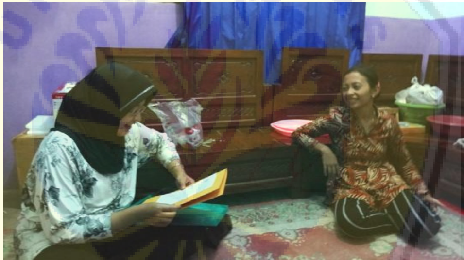
Gambar3.Evaluasi Hasil Penyuluhan dan Pelatihan Produksi Keripik