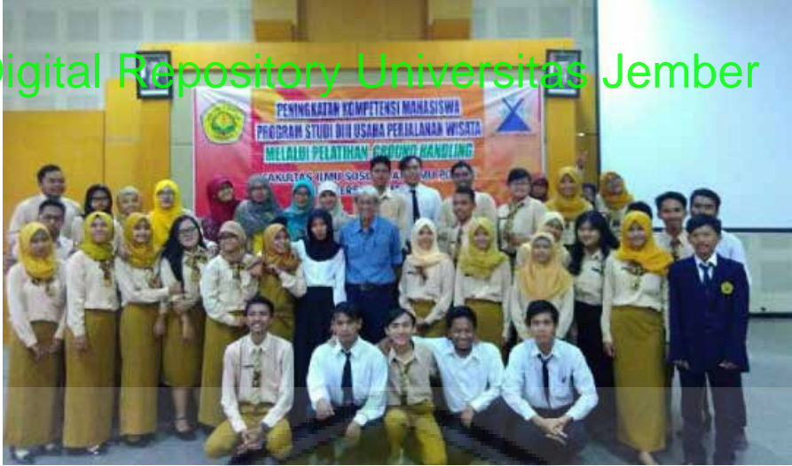
Foto 3. Mahasiswa mengikuti pelatihan ground handling .

diterima, promosi melalui media cetak, promosi melalui internet, promosi oleh alumni, promosi melalui sosialisasi ke SMA, promosi melalui pameran pendidikan, kemampuan mengajar dosen, kemampuan dosen memberikan motivasi belajar mahasiswa, kerjasama dengan alumni, kesesuaian antara teori dan praktek, keberadaan sarana perkuliahan dan keberadaan prasarana pendukung perkuliahan.