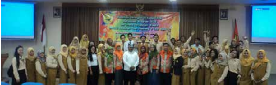
Foto 1. Mahasiswa berfoto bersama sebelum melakukan pelatihan perencanaan tur dan pemandu wisata.

Matrik internal factor analisis summary (IFAS) dan matrik eksternal factor analisis summary (EFAS) digunakan untuk mengetahui kekuatan, kelemahan, peluang dan ancaman, selanjutnya analisis SWOT ( Strength, Weaknesses, Opportunites, Threat ) untuk menghasilkan strategi alternatif dan analisis QSPM ( Quantitative Strategies Planning Matrix ) untuk menghasilkan strategi prioritas.