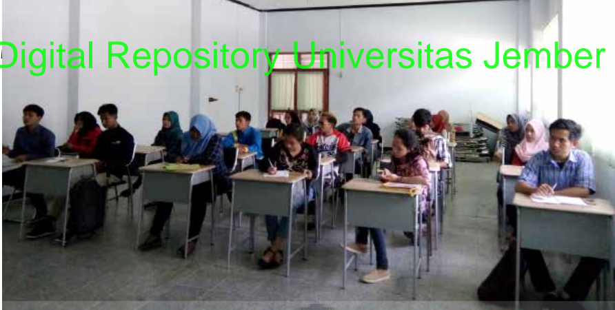
Foto 2. Mahasiswa mengikuti perkuliahan.