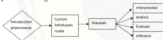
Gambar 3 Alur skenario model real life video evaluation yang dikembangkan

Jika dibandingkan dengan gambar/foto dalam hal tampilan ketika video ini dikembangkan akan lebih menunjukkan suatu kegiatan yang lebih hidup karena memberikan detail suatu peristiwa. Proses ini membuat suatu informasi yang lebih lengkap dan memiliki nilai kegrafisan tinggi. Fungsi dubbing dalam video adalah memberikan arahan yang akan memandu mahasiswa dalam mengamati video ini. Pelaksanaan pembelajaran dengan menggunakan real life video evaluation harus didukung dengan menggunakan perangkat yang memadai seperti harus adanya saran komputer, jaringan internet, software pemutar video seperti adobe flash player, dan earphone. Karena selain video ini memberikan layanan unggulan grafis yang baik juga melibatkan audio yang akan menunjukkan proses terjadinya fenomena, bukti-bukti nyata dan ada beberapa pertanyaan hanya cukup disampaikan dengan proses dubbing.