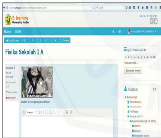
Gambar 2 Salah satu contoh bentuk tampilan real life video evaluation menggunakan sistem e-learning

Berdasarkan tabel 2 didapatkan indikator yang telah ditentukan dalam berpikir kritis adalah melingkupi kegiatan menginterpretasi, menganalisis, mengevaluasi dan menginferensi. Langkah berikutnya adalah melakukan tes kepada 45 siswa untuk mengetahui penguasaan digital literasi menggunakan sistem e-learning. Instrumen tes digital literasi yang digunakan menggunakan skala likert dimana pilihan 4 = sangat baik, 3 = baik, 4= kurang dan 1 buruk. Instrumen tersebut telah dilakukan uji cronbachs alpha untuk menentukan konsistensi konstruktif dengan nilai \alpha = 0,922 . Uji lieterasi digital ini dilakukan sebagai bentuk meminimalisasi kurang siapnya mahasiswa dalam melakukan pembelajaran menggunakan sistem e-learning. Selain itu juga melatih mahasiswa dalam menggunakan sistem e-learning. Hasil yang didapatkan pada uji lietarsi digital ini menunjukkan bahwa kesiapan mahasiswa dalam melaksanakan pembelajaran dengan sistem e-learning adalah masuk dalam katagori baik.