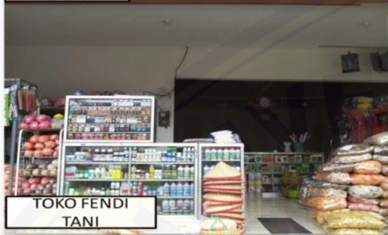
TOKO FENDI TANI