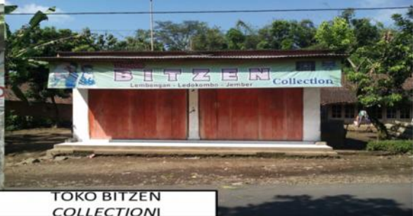
TOKO BITZEN COLLECTION