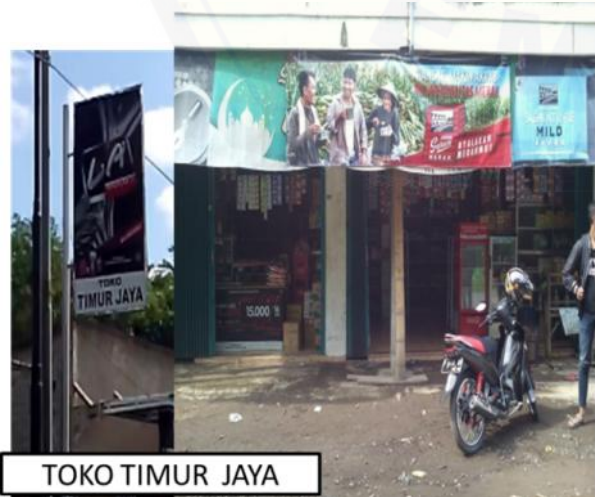
TOKO TIMUR JAYA