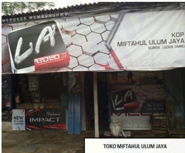
TOKO MIFTAHUL ULUM JAYA