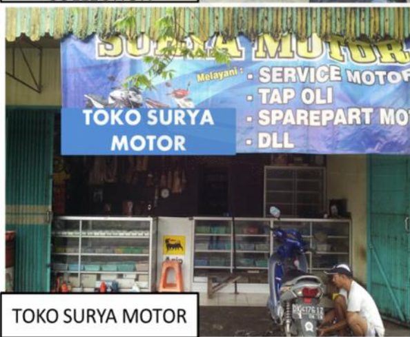
TOKO SURYA MOTOR