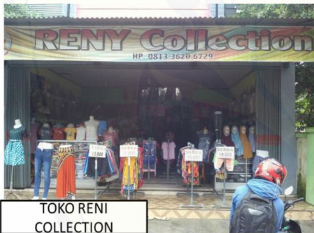
TOKO RENI COLLECTION