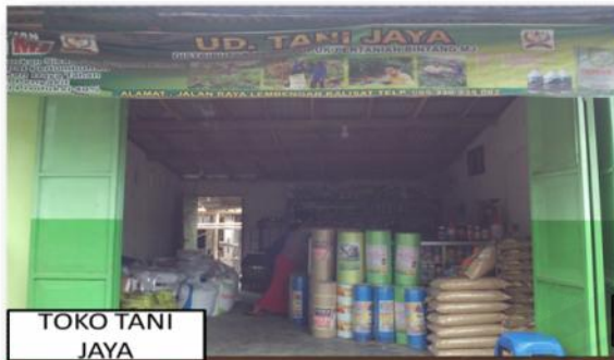
TOKO TANI JAYA