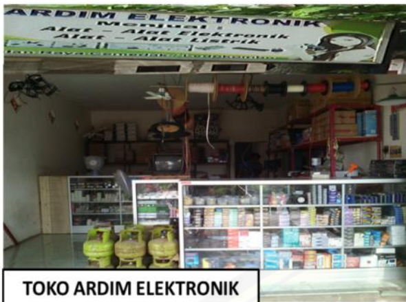
TOKO ARDIM ELEKTRONIK