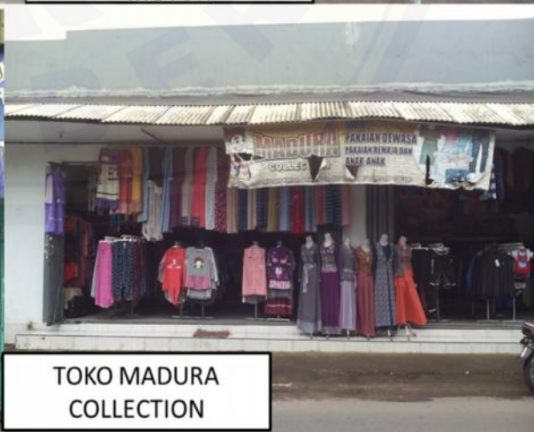
TOKO MADURA COLLECTION