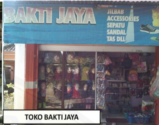
TOKO BAKTI JAYA