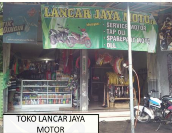
TOKO LANCAR JAYA MOTOR