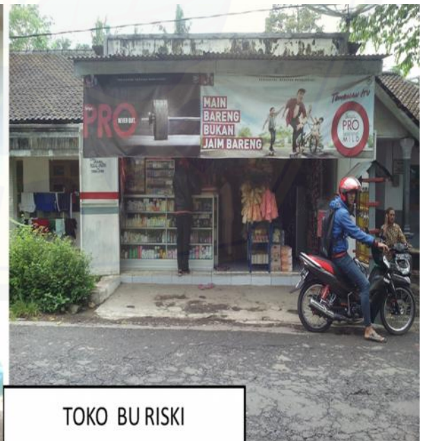
TOKO BU RISKI