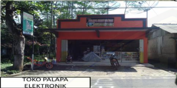
TOKO PALAPA ELEKTRONIK