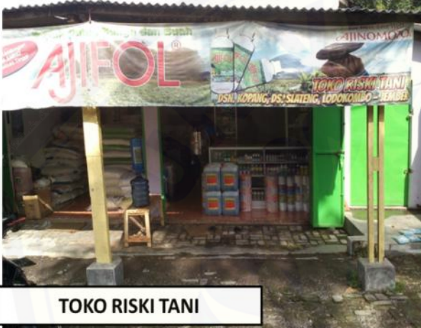
TOKO RISKI TANI