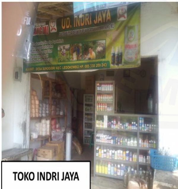
TOKO INDRI JAYA