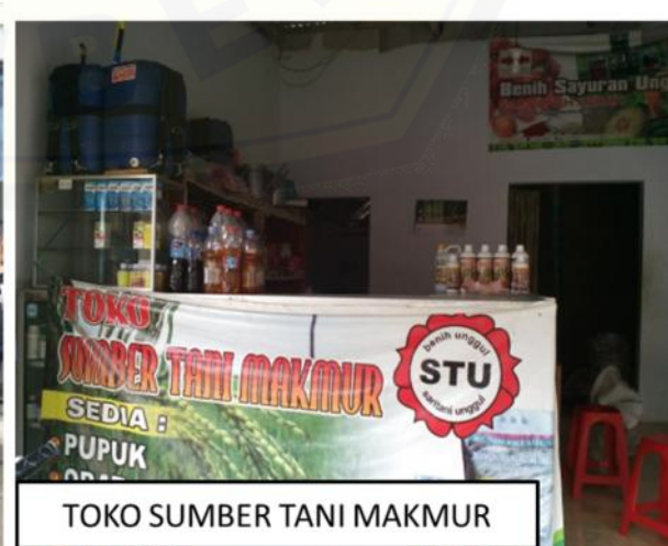
TOKO SUMBER TANI MAKMUR