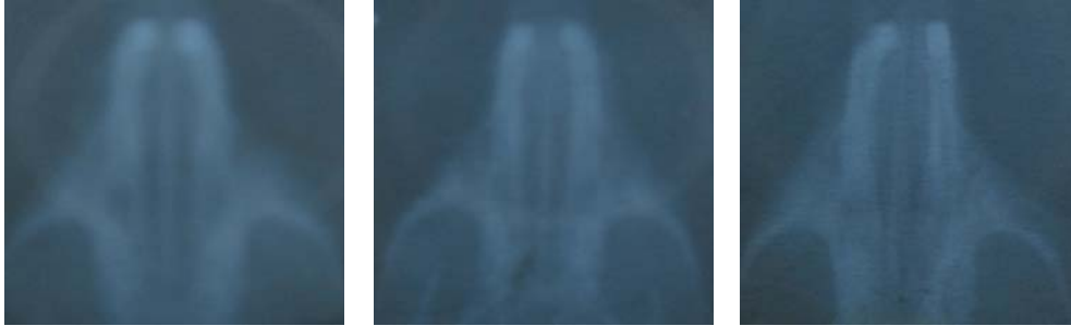
Gambar 3. Rontgenogram pergerakan gigi insisif. Pergerakan gigi insisif pada gaya 10 grF (A), gaya 20 grF (B), dan gaya 30 grF (C) menunjukkan kesejajaran dengan garis median rahang (anak panah kuning).