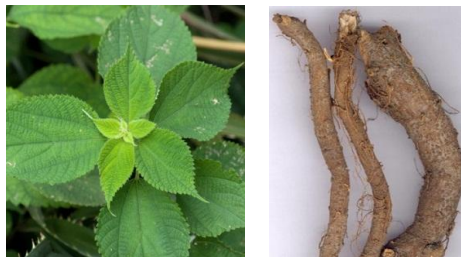
Gambar 1. Boehmeria nivea

Akar rami diperoleh dari Balittas (Balai Penelitian Tanaman Pemanis dan Serat) Malang, Jawa Timur, merupakan Boehmeria nivea varietas Pujon 303 (Gambar 1). Akar rami seberat 20 kg dikeringkan dengan cara diangin-anginkan kemudian dihaluskan hingga mendapat 5,2 kg serbuk kering. Serbuk kemudian dimaserasi menggunakan etanol 70% dengan perbandingan 1:5. Ekstrak kental yang didapat berwarna coklat muda dengan rendemen sebesar 1,2%.