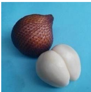
Gambar 1. Bentuk buah salak varian gula pasir.

Ukuran bijinya relatif kecil. Salah satu kelebihan dari buah salak varian ini adalah rasanya yang sangat manis seperti gula pasir, sehingga dinamakan salak varian gula pasir (Redaksi Agromedia Pustaka, 2009).