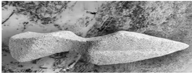
Gambar 5: Kujang Purba atau Bajak Kecil di Gunung Padang

Data arkeologis di Jawa Timur, khususnya di sekitar gunung Ijen dan Argapura menguatkan dugaan bahwa Medang Kamulan pernah berpusat di Jawa Timur. Situs penguat tersebut berupa (a) Batu Solor di Cerme Bondowoso di lembah gunung Ijen, (2) Situs “Duplang Kamal-Pandak” di lembah gunung Argapura Jember, (3) Situs megalitikum yang mengarah pada penandaan 1 Saka terdapat di situs “Watu Ondho” Besuki Situbondo, batu Dandang (Cindogo) di Sungai Sampean Bondowoso, patung Batu bertulis “Saka” dengan huruf Melayu purba desa Solor di lembah Ijen, dan (4) situs Socapangipok Jember yang diduga tempat persemayaman abu raja Ajisaka dan para leluhurnya di lembah gunung Argapura di Jalabuka (Jelbuk) Jember.