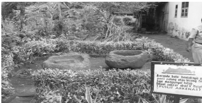
Gambar 6: Peralatan Pandai Besi dari Batu Era Neolitikum Masyarakat Deutro-Melayu di Seputih Mayang Jember

Penelitian arkeologi dari UGM menerangkan bahwa situs hunian di Kendenglembu Banyuwangi, sejauh ini masuk kategori situs hunian neolitik yang tertua di Indonesia, seperti dilaporkan dalam penelitian Tahap 2 (Tim, 1987), Tahap 1 (Tim, 2008), dan Tahap 2 (2009). Sampai sekarang belum terjawab mengapa nenek moyang memilih Kendenglembu sebagai tempat menetap pertama kali di Nusantara. Fakta ini mendukung pemikiran bahwa kerajaan tertua Nusantara lahir di kawasan Jawa Timur.