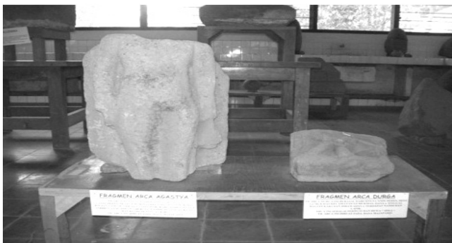
Gambar 3: Arca Agastya dan Durga, Produk Era Siwa-Budha Klasik Ditemukan di Patrang Jember

Bukti arkeologis bahwa masyarakat di sekitar gunung Argapura adalah penyembah Durgha dan juga Siwa-Budha adalah ditemukannya Patung Dewi Durgha Purba (Betoh Nyai), Patung Siwa Kuna (Betoh Kyai), dan juga menhir (lingga purba) sebagai simbol Siwa yang terdapat di wilayah Jember, Bondowoso, dan Situbondo perbatasan. Batu Nyai adalah patung Dewi Durgha dalam wujud primitif. Dewi Durgha adalah istri Siwa yang dipercaya sebagai Dewi Kesuburan. Sebab itulah, patung Betoh Nyae (versi Madura) ini sering ditemukan di ladang milik penduduk Jawa Kuna. Patung Betoh Kyai sebenarnya adalah patung Agastya kuna yang penggambarannya sesuai taraf imajinasi masyarakat Argapura waktu itu. Temuan berupa Arca Agastya dan Durga dalam versi yang lebih modern di Patrang Jember membuktikan bahwa masyarakat Siwa-Budha di lembah Argapura telah mengalami evolusi budaya sesuai dengan perkembangan zaman.