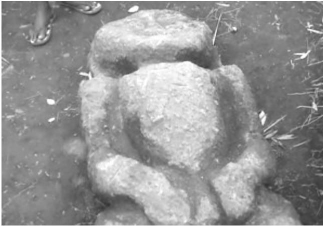
Gambar 2: Patung Batu Kyai Ditemukan Masyarakat desa Pekauman Bondowoso Bukti Sejarah Deutro-Melayu Nusantara

Bukti arkeologis bahwa masyarakat di sekitar gunung Argapura adalah penyembah Durgha dan juga Siwa-Budha adalah ditemukannya Patung Dewi Durgha Purba (Betoh Nyai), Patung Siwa Kuna (Betoh Kyai), dan juga menhir (lingga purba) sebagai simbol Siwa yang terdapat di wilayah Jember, Bondowoso, dan Situbondo perbatasan. Batu Nyai adalah patung Dewi Durgha dalam wujud primitif. Dewi Durgha adalah istri Siwa yang dipercaya sebagai Dewi Kesuburan. Sebab itulah, patung Betoh Nyae (versi Madura) ini sering ditemukan di ladang milik penduduk Jawa Kuna. Patung Betoh Kyai sebenarnya adalah patung Agastya kuna yang penggambarannya sesuai taraf imajinasi masyarakat Argapura waktu itu. Temuan berupa Arca Agastya dan Durga dalam versi yang lebih modern di Patrang Jember membuktikan bahwa masyarakat Siwa-Budha di lembah Argapura telah mengalami evolusi budaya sesuai dengan perkembangan zaman.