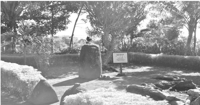
Gambar 1: Prasasti “Duplang Kamal-Pandak” di Arjasa Jember

Prasasti Duplang adalah batas wilayah spiritual yang dilarang untuk dilanggar oleh kedua belah pihak yang berselisih. Bangunan ini dimaksudkan agar di kemudian hari anak cucu ingat di situlah leluhurnya dimakamkan sehingga kedua belah pihak yang berselisih mampu menyadari dan bisa rukun kembali. Prasasti Duplang tersebut berada di kawasan desa Kamal Arjasa Jember sampai dengan desa Pandak Tapen Bondowoso sehingga disebut “Duplang Kamal-Pandak”. Prasasti DKP menegaskan bahwa kawasan Arjasa Jember sampai Tapen Bondowoso merupakan daerah yang diistimewakan sebagai daerah netral dan tidak boleh diperebutkan. Lazimnya di daerah Kamal Pandak dimakamkan leluhur yang amat dihormati.