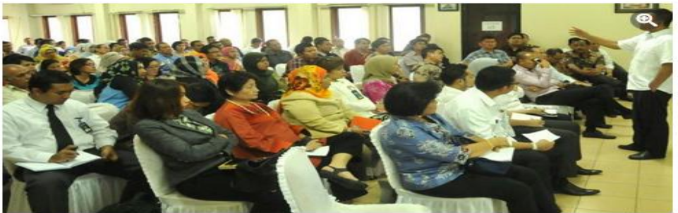
Kepala BNP2TKI, Nusron Wahid, dalam pertemuannya bersama Asosiasi Perusahaan Jasa Tenaga Kerja Indonesia (APJATI) dan seluruh Pelaksana Penempatan Tenaga Kerja Indonesia Swasta (PPTKIS) di Gedung APJATI, Jakarta Selatan, Kamis (1/10/2015).