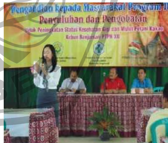
Gambar 1. Tim pengabdian pada saat melakukan penyuluhan

Penyuluhan dan penjelasan kepada para petani kakao mengenai karies dan penyakit jaringan pendukung gigi dilakukan untuk meningkatkan pengetahuan kesehatan gigi dan mulut dan diharapkan dapat meningkatkan status kesehatan mereka. Metode yang digunakan adalah ceramah, dibantu dengan media peragaan gambar/poster dan model gigi, serta dilakukan tanya jawab dengan peserta penyuluhan. Pada kegiatan penyuluhan, para peserta mendapat sikat gigi dan pasta gigi, serta poster yang dapat ditempel di rumah masing-masing. Pertimbangan pemberian poster, supaya keluarga para petani di rumah dapat juga menerapkan pengetahuan mengenai kesehatan gigi dan mulut. Poster juga lebih menarik dengan adanya gambar-gambar dan kalimat edukasi di dalamnya.