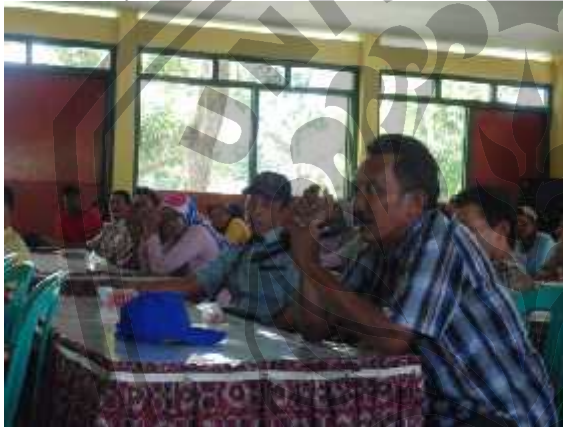
Gambar 2. Salah satu petani mengajukan pertanyaan saat kegiatan penyuluhan

tampak memperhatikan serta mendengarkan ceramah dan demonstrasi yang disampaikan dengan tertib. Mereka dengan antusias mengajukan pertanyaan di sela-sela kegiatan penyuluhan. Hal ini sangat mengembirakan kami para pengabdian karena menunjukkan bahwa mereka memberikan tanggapan yang positif terhadap kegiatan ini. Dengan demikian para petani kakao yang hadir pada acara tersebut dapat menambah pengetahuan dan keterampilan mereka tentang arti penting kesehatan gigi dan mulut dalam rangka meningkatkan kesejahteraan dan kualitas sumber daya manusia di masa mendatang. Diharapkan, para petani yang hadir pada kegiatan ini dapat meneruskan informasi yang telah di dapat kepada keluarga dan masyarakat di sekitarnya.