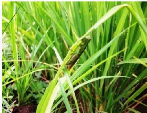
Gambar 2. Oxya sp

Hama belalang ( Oxya sp) termasuk family Acrididae, ordo Orthoptera yang mempunyai kepala yang berbentuk miring dengan mata majemuk yang besar. Tubuh belalang berwarna hijau dan memiliki garis hitam melintang dari mata sampai thorak pada bagian akhir. Kemudian pada belalang betina berukuran 3,5 cm dan yang jantan 3 cm dengan kaki bertipe saltatorial dan berwarna kuning pada bagian femurnya serta hijau pada bagian tibia. Diantara pangkal femur dan tibia terdapat warna hitam. Abdomennya terdiri dari 8 tergum dan 5 sternum (Kalshoven, 1981) (Gambar 2).