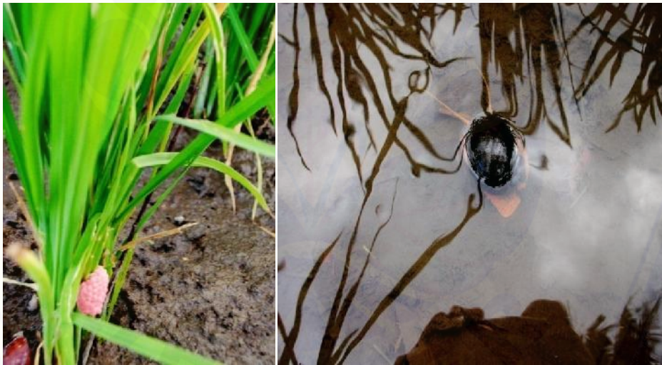
Gambar 3. Telur dan Keong Mas ( Pomacea sp.)

Keong mas dewasa meletakkan telur pada tempat yang tidak tergenang air (tempat yang kering) dan melakukan bertelur pada malam hari pada rumpun tanaman, tonggak, saluran pengairan bagian atas dan rumput-rumputan. Telur keong mas diletakkan secara berkelompok berwarna merah jambu seperti buah murbei sehingga disebut juga keong murbei (Suharto et al. , 2009)