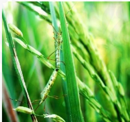
Gambar 1. Leptocorisa oratorius F.

Walang sangit sangit ( L. oratorius ) (Gambar 1) memiliki spot atau bintik hitam di bawah abdomennya dan memiliki telur berwarna merah-coklat gelap berbentuk pipih diletakkan berbaris secara berkelompok pada tulang helai daun bagian atas dengan jumlah mencapai 19 butir. Walang sangit memiliki lima instar nimfa yang berkembang sekitar 19 hari, kemudian berkembang dari telur sampai dewasa 31 hari. Tubuh imago walang sangit betina lebih kecil dibandingkan dengan walang sangit jantan (Hosamani et al. , 2009).