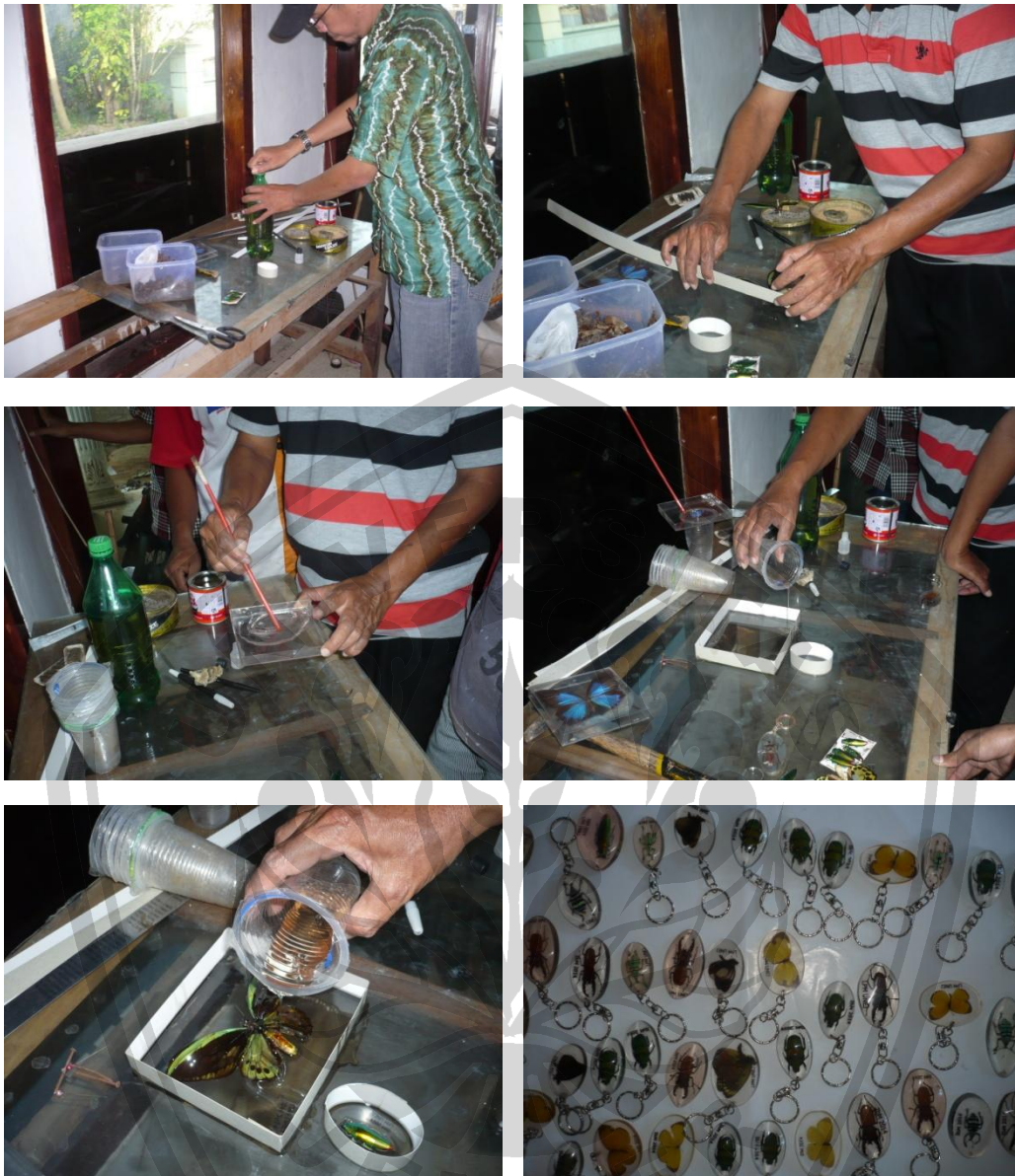
Gambar 6. Proses Membuat Awetan Serangga dengan cara Embedding