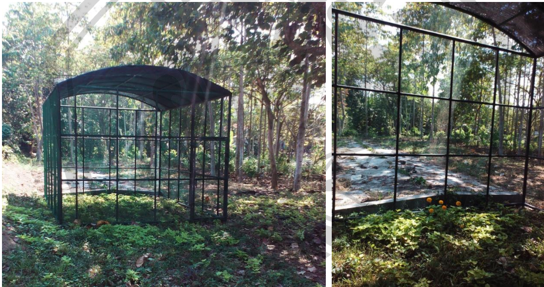
Gambar 7. Rumah Kupu-Kupu

Proses penangkaran kupu-kupu nantinya dimulai dengan cara mencari berbagai spesies kupu-kupu, ulat atau kepompong dari alam kemudian dimasukkan dalam rumah kupu-kupu yang sudah diberi tanaman. Tanaman yang digunakan untuk perbanyakan kupu yaitu tanaman jeruk dan berbagai bunga-bunga yang dapat menghasilkan nektar sebagai sumber makanan bagi kupu-kupu (Gambar 7).