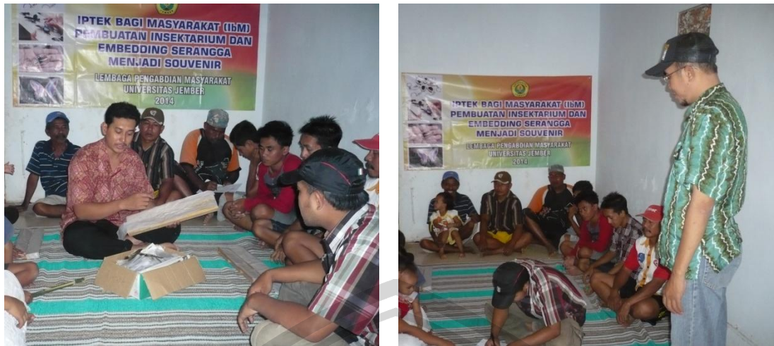
Gambar 2. Kegiatan penyuluhan Cara membuat Awetan Serangga

Kegiatan ini selanjutnya dilakukan praktek bagaimana cara mengawetkan serangga terutama serangga-serangga dari golongan Lepidoptera seperti kupu-kupu dan serangga ordo Coleoptera seperti Kumbang badak. Kegiatan ini dilakukan dengan beberapa tahapan yaitu (a) Tahap I, praktek menyimpan serangga, (b) Tahap II, praktek merentangkan sayap kupu-kupu, (c) Tahap III, praktek mengeringkan serangga, (d) Tahap IV, praktek membuat bingkai serangga, dan (e) Tahap V, membuat souvenir dari serangga.