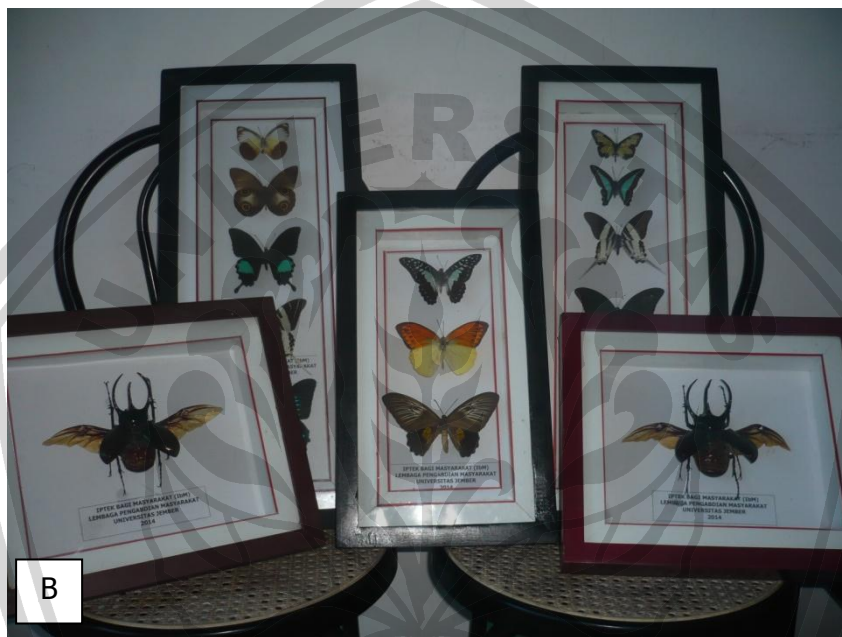
Gambar 5. A. Bingkai untuk menyimpan kupu-kupu, B. Kupu-kupu yang sudah disimpan dalam bingkai kayu