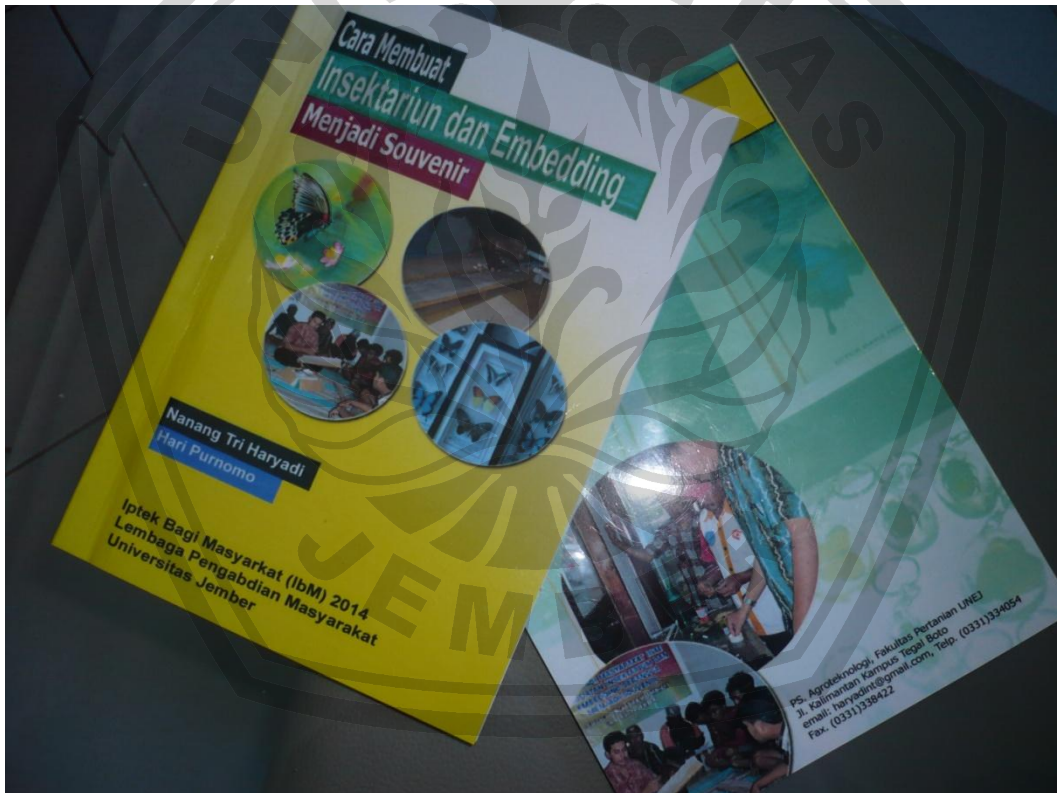
Gambar 8. Buku panduan tentang cara membuat insektarium dan embedding menjadi souvenir

Kegiatan IbM ini juga membuat buku petunjuk tentang cara bagaimana membuat insektarium dan Embedding menjadi sebuah Souvenir. Buku ini berisi 64 halaman yang terdiri dari beberapa bab yaitu Bab 1. Tentang Cara koleksi serangga, dalam bab ini dijelaskan tentang alat-alat yang digunakan untuk koleksi serangga dan metode-metode untuk mengkoleksi serangga, Bab 2. Menjelaskan tentang bagaimana cara mengawetkan serangga dengan menggunakan bahan resin, bab 3. Menjelaskan tentang cara membuat insektarium, bab 4. Menjelaskan tentang bagaimana memberi label awetan serangga agar mempunyai nilai ilmiah, Bab 5, menjelaskan tentang cara menangkarkan serangga. Berikut ini adalah cover depan dan belakang buku panduan membuat insektarium dan embedding serangga.