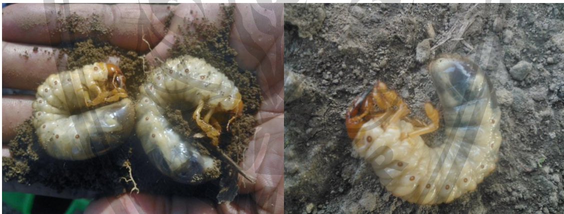
Gambar 9. Larva serangga dari ordo Coleoptera

Tahap berikutnya yaitu mengumpulkan larva serangga dari lapangan untuk dipelihara pada media perbanyakan.