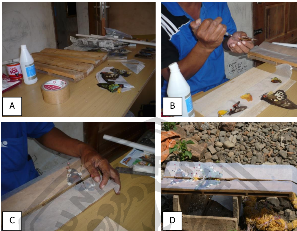
Gambar 4. A. Papan perentangan, B. Melemaskan sayap kupu-kupu, C. Merentangkan sayap kupu-kupu, D. Menjemur dengan panas matahari

Tahap berikutnya yaitu praktek membuat bingkai untuk kupu-kupu yang sudah kering dan siap dipasang dalam tempat penyimpanan. Bahan yang digunakan untuk membuat bingkai serangga yaitu kayu untuk bingkai, kaca, kertas karton, lem dan isolasi. Bingkai berbentuk persegi panjang atau bujur sangkar, panjang dan lebar bingkai disesuaikan dengan isi yang akan dipasang (Gambar 5).