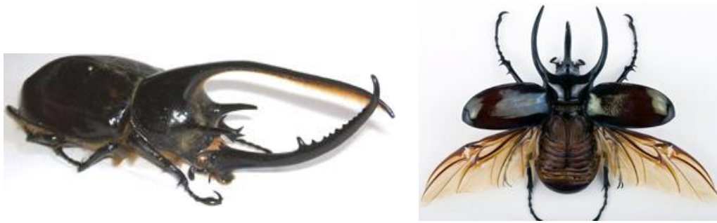
Gambar 1. Serangga-serangga Ordo Coleoptera (Kumbang Bertanduk) yang banyak diburu Kolektor

Kegiatan menangkap serangga ini tidak hanya dilakukan di Kabupaten Jember, tetapi juga banyak dilakukan oleh warga Desa Breml, Kabupaten Probolinggo, Jawa Timur seperti yang dilaporkan liputan 6.com (2002). Mereka berusaha mengekspor kumbang tersebut ke Jepang dengan omzet mencapai puluhan juta rupiah. Menurut warga Desa Breml, baru-baru ini, kumbang berwarna hitam itu memiliki nilai jual karena di Jepang, terutama bagi anak-anak dan remaja, hewan yang bagian kepalanya bertanduk atau memiliki cula kecil seperti pada badak itu digemari sebagai hewan piaraan. Rata-rata seorang pengepul di Breml mampu mengekspor kumbang dewasa dengan omzet Rp 60 juta dalam waktu tiga-lima bulan. Kumbang tersebut dikirim ke Jepang setelah dibius terlebih dahulu dan dimasukkan dalam plastik beroksigen, hal ini dimaksudkan agar kumbang mati suri selama 12 jam perjalanan. Hewan itu akan segar kembali bila diberi aliran listrik atau sinar matahari ketika tiba di tujuan. Namun, permasalahan yang muncul yaitu mayoritas warga masih mencari di alam bebas dan belum merencanakan menangkarkan sendiri.