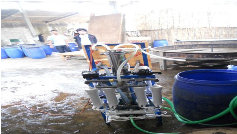
Gambar 9. Alat membran Ultrafiltrasi