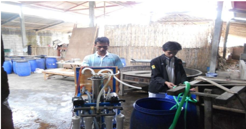
Gambar 10. Uji Coba Alat membran Ultrafiltrasi