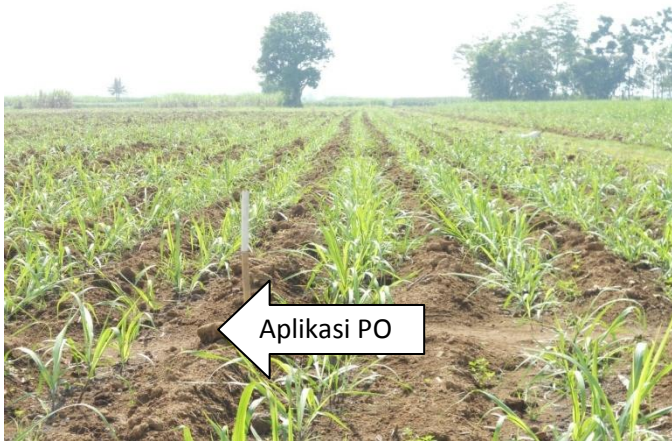
Gambar 4. Lokasi Lahan Demplot Pupuk Organik