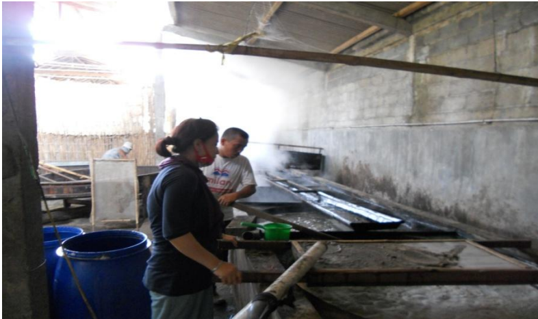
Gambar 7. Pembuatan Gula Merah Cair