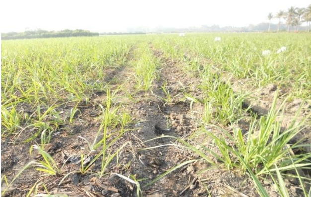
Gambar 2. Lokasi Lahan Demplot