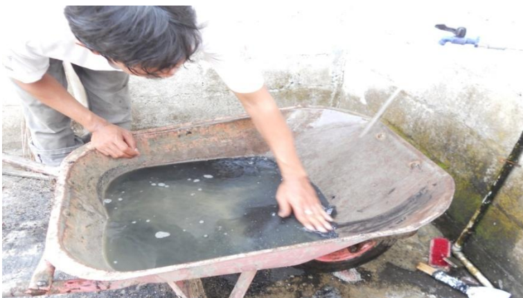
Gambar 11. Pembuatan Karbon Aktif dari Limbah Abu Sekam