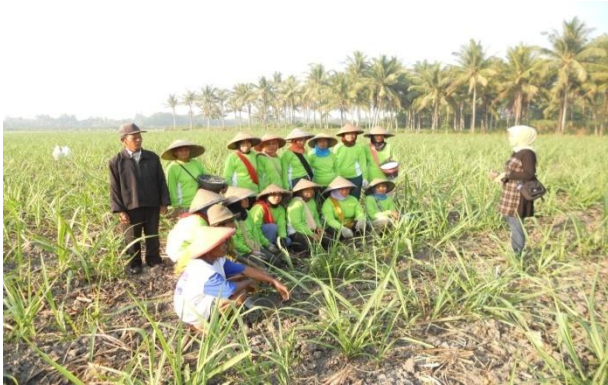
Gambar 1. Sosialisasi dan Penyuluhan Budidaya Tebu