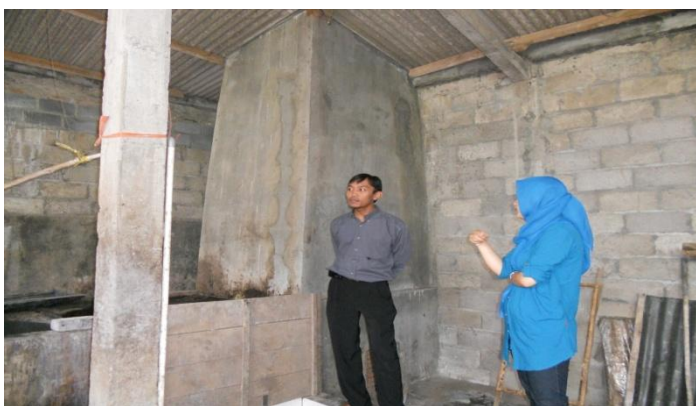
Gambar 6. Lokasi Usaha Gula Merah