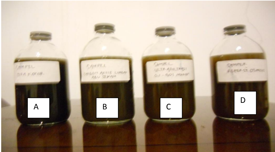
Gambar 12. Hasil Nira (A) Nira Kotor, (B) Nira melewati Karbon Aktif, (C) Nira melewati Ultrafiltrasi, (D) Nira Melewati Reverse osmosis