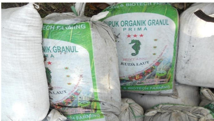
Gambar 5. Pupuk Organik