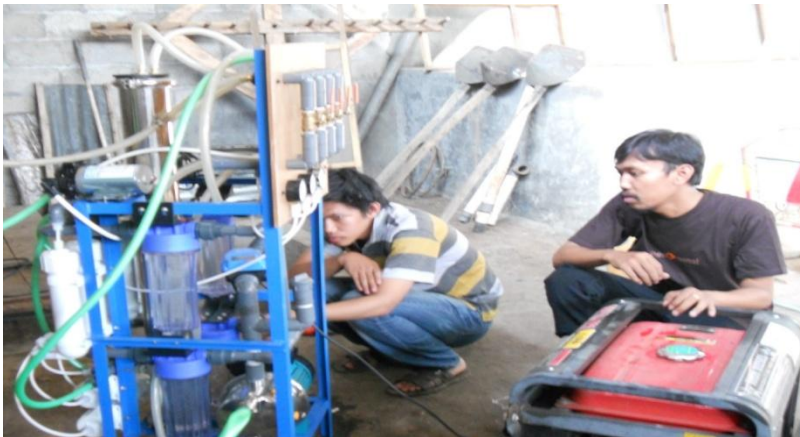
Gambar 8. Penggunaan Alat Membran Ultrafiltrasi