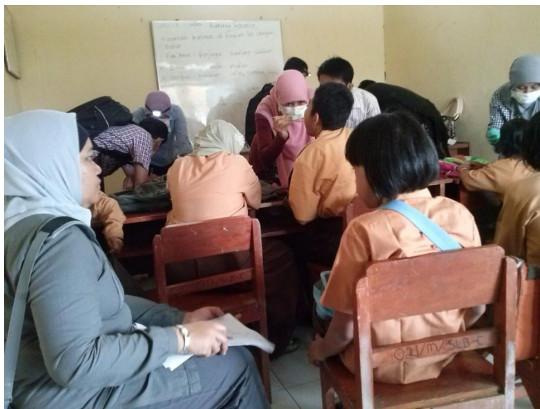
Gambar 11. Siswa-siswi yang sedang menunggu untuk dilakukan perawatan