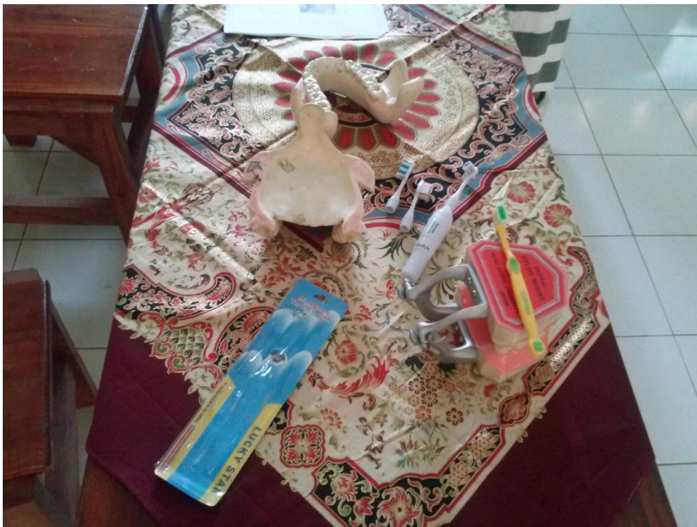
Gambar 2. Sikat gigi elektrik, alat peraga, dll