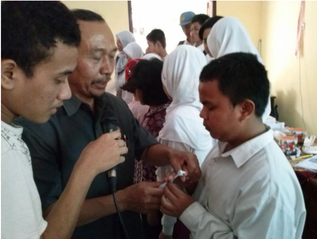
Gambar 6. Pelatihan pada anak-anak berkebutuhan khusus penggunaan sikat gigi elektrik