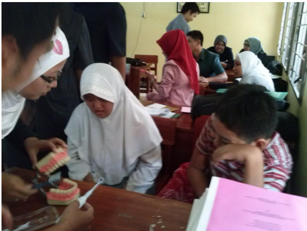
Gambar 4. Pelatihan pada anak-anak SLB C