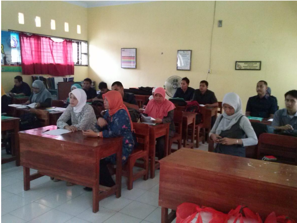
Gambar 1. Penyuluhan pada guru-guru dan wali murid