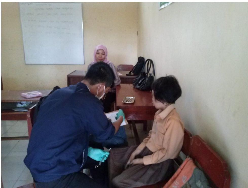
Gambar 7. Pemeriksaan anak berkebutuhan khusus