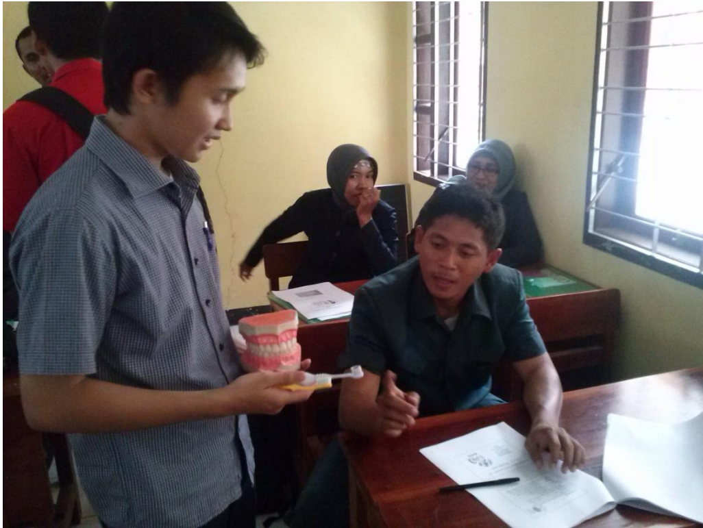
Gambar 3. Pelatihan pada guru-guru