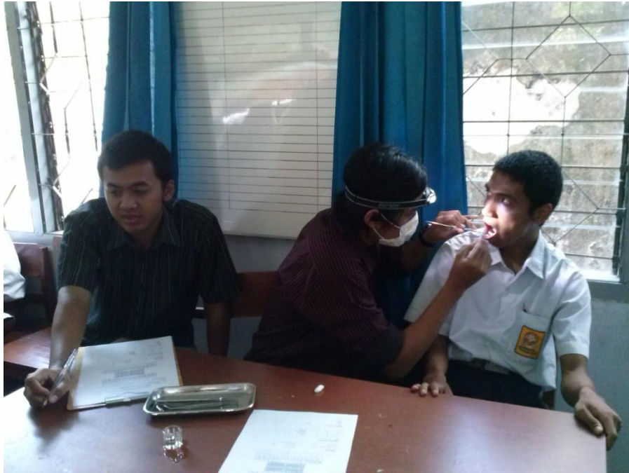
Gambar 10. Perawatan yang dilakukan pada siswa siswi SLB