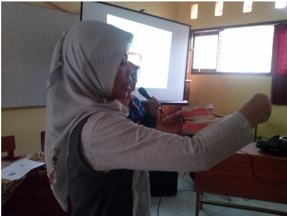
Gambar 9. Tim sedang memberikan pelatihan