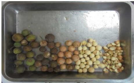
Gambar 2. Buah nyamplung dari hijau hingga siap diekstraksi

sehingga didapatkan buah nyamplung. Buah nyamplung kemudian diblender sehingga menjadi dimensi kecil seperti ampas kelapa. Buah nyamplung berdimensi seperti ini memudahkan untuk melakukan ekstraksi mekanik (press) menjadi minyak nyamplung.