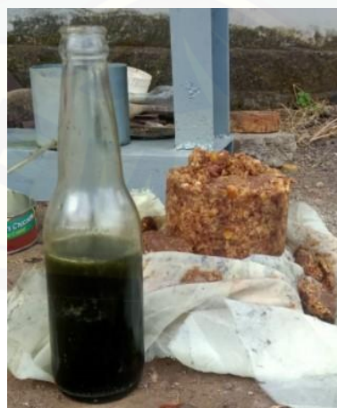
Gambar 4. Hasil minyak nyamplung

Semua proses pembuatan minyak nyamplung ini diperagakan oleh mahasiswa. Peserta juga diperlihatkan bagaimana hasil dari minyak yang dihasilkan dari proses tersebut. Minyak nyamplung yang dihasilkan bisa digunakan sebagai bahan bakar kompor minyak. Jika minyak nyamplung diproses lebih lanjut dengan beberapa tahapan, bisa menghasilkan biodiesel. Ini