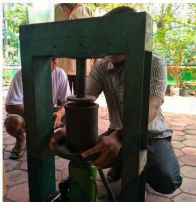
Gambar 3. Proses ekstraksi biji nyamplung

Ampas buah nyamplung setelah diblender dibungkus kain kemudian diekstraksi mekanik menggunakan alat press seperti ditunjukkan pada Gambar 3. Kain berfungsi sebagai filter agar ampas nyamplung tidak bercampur dengan minyak yang dihasilkan. Ekstraksi dilakukan beberapa kali untuk memberikan kesempatan terjadinya minyak nyamplung. Dari 1 kg buah nyamplung dihasilkan sekitar 300 ml minyak nyamplung. Hasil ekstraksi menghasilkan minyak nyamplung ditunjukkan pada Gambar 4.