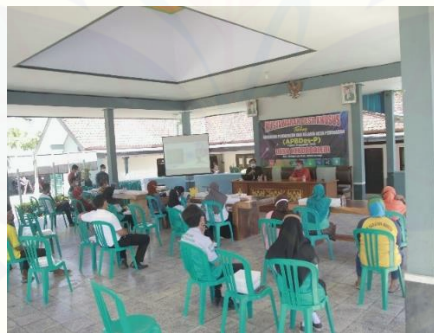
Gambar 1. Pelaksanaan kegiatan

Kegiatan pengabdian ini diawali dengan pembukaan oleh Kepala Desa Kebondalem yang memberikan gambaran tujuan acara ini diadakan. Kepala desa juga berharap dengan kegiatan ini bisa menggerakkan ekonomi masyarakat Desa Kobendalem. Kegiatan ini dilaksanakan di Balai Desa Kebondalem Kecamatan Bangorejo Kabupaten Banyuwangi, seperti ditunjukkan pada Gambar 1. Pada gambar tersebut terlihat bahwa kegiatan dilakukan dengan menerapkan protokol Kesehatan, sehingga tempat duduk berjarak dan semua peserta menggunakan masker.