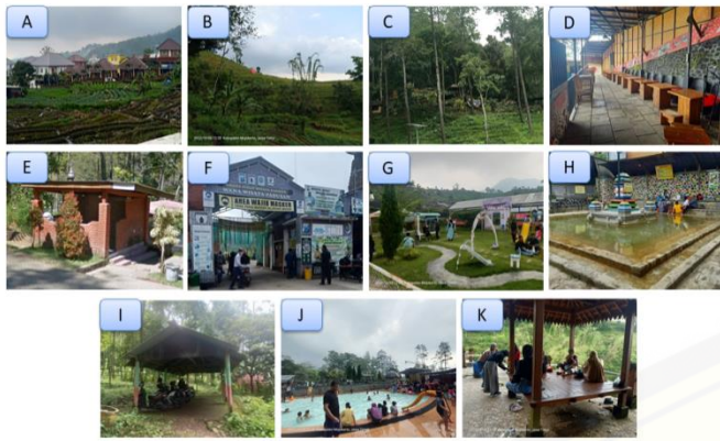
Gambar 4. A) Pemandangan Alam, B) Keasrian Lingkungan, C) Keteduhan Lingkungan, D) Foodcourt , E) Tempat Ibadah, F) Pos Keamanan, G) Area Bermain Anak-Anak, H) Kolam, I) Tempat Parkir, J) Berenang dan Berendam, dan K) Menikmati Keindahan Alam

Hasil dari observasi kondisi eksisting di kawasan wisata alam Desa Padusan terkait 11 indikator yang termasuk dalam kuadran II pada Gambar 4. ini memiliki kondisi yang cukup baik. Pemandangan alam serta keasrian lingkungan di Desa Padusan masih terjaga keasliannya serta terus dipertahankan. Foodcourt , tempat ibadah, pos keamanan, area bermain anak-anak, kolam, dan tempat parkir menjadi pendukung wisata yang mampu menjadi daya tarik wisatawan, akan tetapi harus terus ditingkatkan. Wisatawan yang berkunjung tentunya akan tertarik dengan aktivitas yang dapat dilakukan, yaitu berenang dan berendam serta menikmati keindahan alam yang tidak dapat diperoleh di daerah perkotaan. Oleh karena itu, indikator di kuadran II ini sudah cukup bagus dan perlu dipertahankan untuk mendukung pengembangan kawasan wisata alam Desa Padusan.