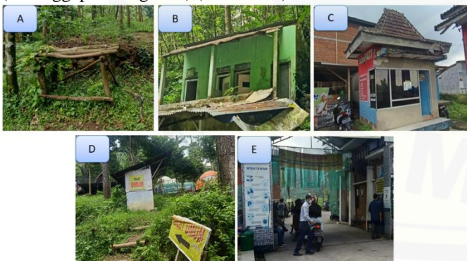
Gambar 3. A) Tempat Duduk, B) Toilet/MCK, C) Pos Kesehatan, D) Penanda dan Penunjuk Arah, dan E) Ketanggapan Pengelola

Kuadran I merupakan kuadran yang memiliki prioritas utama dalam melakukan pengembangan, sehingga dapat dikatakan bahwa kuadran I memiliki kepentingan yang tinggi akan tetapi kondisi saat ini di kawasan wisata alam Desa Padusan masih belum memenuhi kepuasan pengunjung. Adapun indikator yang termasuk dalam kuadran I terdapat 5 indikator, yaitu A7 (Tempat Duduk), A11 (Toilet /MCK), A15 (Pos Kesehatan), A21 (Penanda dan Penunjuk Arah), dan A27 (Ketanggapan Pengelola) (Gambar 3.).