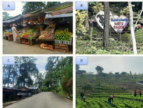
Gambar 6. A) Pusat Oleh-Oleh, B) Spot Foto, C) Jaringan Jalan, dan D) Petik Stroberi

Kuadran IV memiliki tingkat kepuasan yang tinggi sehingga dapat dikatakan pada kondisi eksisting di kawasan wisata alam Desa Padusan sudah memiliki kondisi yang sangat baik. Akan tetapi walaupun pada kawasan wisata alam Desa Padusan sudah memiliki kondisi sangat baik, indikator pada kuadran IV bukan memiliki kepentingan yang utama untuk menggunakan indikator tersebut. Adapun indikator yang termasuk dalam kuadran IV terdapat 4 indikator, yaitu A9 (Pusat Oleh-Oleh), A17 (Area atau Spot Foto), (A19 (Jaringan Jalan), dan A32 (Petik Stroberi) (Gambar 6.).