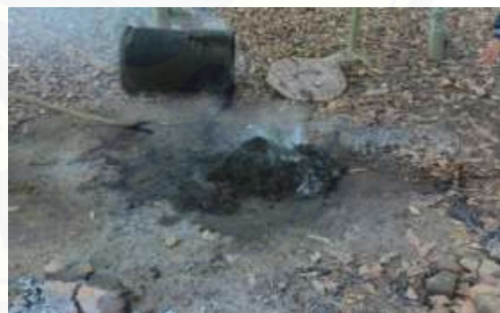
Gambar 2. Hasil Biochar Jerami Padi dengan Pembakaran Suhu 150-170°C Selama 3 Jam

Percobaan ketiga dilakukan pembakaran pada suhu sekitar 150-170°C dengan durasi waktu yang lebih singkat yaitu 3 jam. Jerami yang telah dibakar selama 3 jam kemudian dikeluarkan dari tong dan disiram dengan menggunakan air. Penyiraman hasil pembakaran dilakukan untuk menghentikan pembakaran jerami lebih lanjut (Widiastuti & Lantang, 2017). Hasil yang didapatkan pada percobaan ketiga memiliki tingkat keberhasilan tertinggi yaitu 98% terlihat dari jumlah arang yang terbentuk lebih banyak dibandingkan dengan abu ataupun jerami yang tidak terbakar.