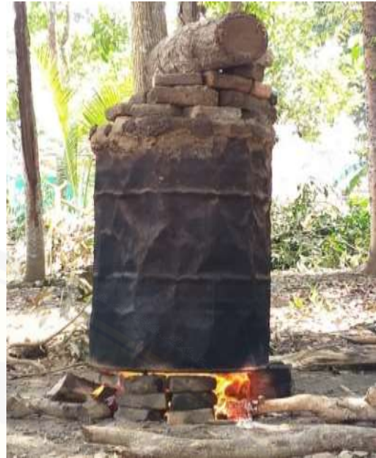
Gambar 1. Pembakaran Jerami Padi dengan Metode Pirolisis

Keberhasilan pembuatan biochar skala kecil selanjutnya diaplikasikan untuk pembuatan biochar skala besar. Proses pembuatan biochar pada skala besar dilakukan sebanyak tiga kali percobaan dengan suhu dan waktu pembakaran yang berbeda-beda. Percobaan pertama dilakukan dengan menggunakan suhu yang sama seperti pembuatan biochar skala kecil yaitu 250°C. Perbedaannya terletak pada waktu pembakaran yang lebih lama yaitu selama 6 jam. Hasil yang didapatkan lebih banyak jerami yang berubah menjadi abu. Kegagalan dalam percobaan ini terjadi akibat penutup tong tidak tertutup rapat sehingga oksigen yang berada di luar tong dapat masuk ke dalam tong. Oksigen tersebut dapat menyebabkan nyala api semakin besar dan pembakaran jerami menjadi tidak terkontrol (Yan et al., 2005). Percobaan kedua dilakukan dengan suhu yang lebih rendah yaitu 170°C dengan lama pembakaran 6 jam. Langkah untuk meminimalisir masuknya oksigen ke dalam sistem dilakukan penyumbatan lubang di sekitar penutup tong dengan menggunakan tanah basah. Hasil dari pembakaran pada percobaan dua ini mengalami kegagalan karena dari hasil pembakaran masih berupa abu.