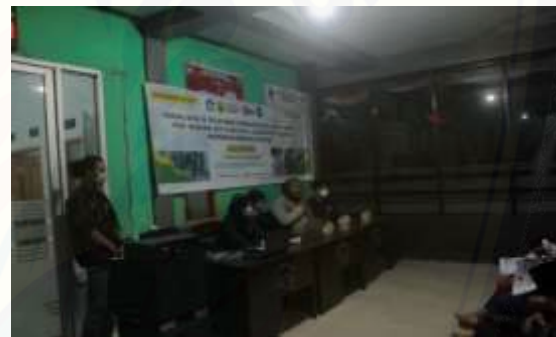
Gambar 5. Kegiatan Sosialisasi dan Penyuluhan Pembuatan Biochar

Kegiatan penyuluhan pembuatan biochar ini difokuskan untuk para remaja yang ada di Desa Tegal Mijin. Para remaja dinilai memiliki kemampuan lebih mudah dalam mempelajari dan memahami teknologi baru yang sedang berkembang di era saat ini. Kegiatan penyuluhan ini bertujuan untuk memberikan informasi terkait suatu metode yang dapat digunakan di lahan pertanian yang berada di Desa Tegal Mijin. Biochar dapat digunakan untuk meningkatkan kualitas dari tanah atau lahan pertanian sehingga kualitas produksi dari tanaman dapat lebih maksimal. Sebanyak sekitar 305 orang di Desa Tegal Mijin berprofesi sebagai petani atau mengurus perkebunan, sedangkan angka pelajar yang ada di desa ini mencapai 420 orang. Potensi pertanian dan perkebunan di desa ini sangatlah besar sehingga potensi tersebut dapat dimaksimalkan dengan adanya kemajuan ilmu pengetahuan dan teknologi, serta kualitas dari sumber daya manusianya.