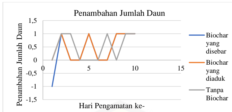
Gambar 4. Grafik Penambahan Jumlah Daun Bibit Cabai Selama 10 Hari

Penambahan biochar jerami padi ini juga dapat merangsang pertumbuhan bibit cabai A yang lebih tegak dibandingkan dengan bibit cabai B dan C. Hal tersebut disebabkan oleh adanya kandungan silika dalam jerami padi sebanyak 70,8% (Purwaningsih et al., 2012). Kandungan silika dalam biochar tersebut dapat meningkatkan kadar mineral dalam tanah dan terserap oleh tanaman. Silika oleh tanaman digunakan sebagai bahan penyusun dinding sel tanaman sehingga tanaman akan tumbuh lebih tegak dan kokoh (Munawar, 2011).