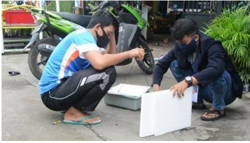
Gambar 5. Pembuatan instalasi hidropnik dan nutrisi AB MIX.