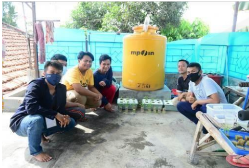
Gambar 6. Panen