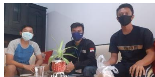
Gambar 4. Pembibitan