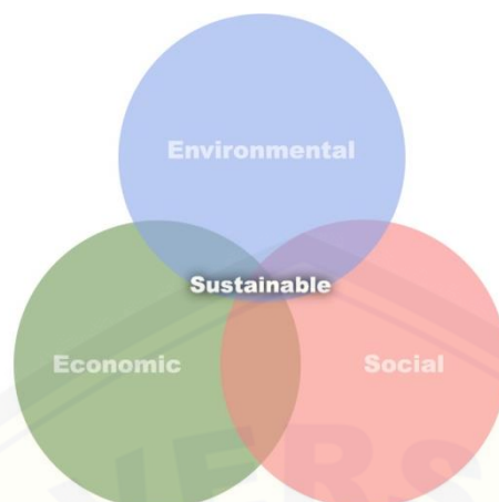
Gambar 2 Dimensi-dimensi Green Industry

3 dimensi pokok, yakni: lingkungan ( enviromental ), ekonomis ( economic ), dan sosial ( social ). Ketiga dimensi ini akan bermuara pada keberlanjutan pada tiap-tiap dimensi tersebut.