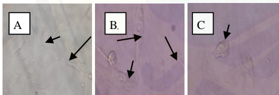
Gambar 1. Sel-sel yang mengalami pertumbuhan dan proliferasi A. medium \alpha -MEM, B. Medium silika dari sekam padi, C. Medium 58S bioactive glass , (tanda panah menunjukkan osteoblas)

Analisis statistik dengan uji Anova menunjukkan terdapat perbedaan rerata nilai absorbansi kultur osteoblast secara bermakna ( p < 0,05 ) pada kelompok penelitian. Hal ini menunjukkan bahwa medium mempunyai pengaruh kuat pada tingkat proliferasi sel osteoblast. Medium yang dikondisikan dengan glas silika sekam padi secara bermakna ( p < 0,05 ) mempunyai rerata yang lebih tinggi dibandingkan medium tanpa glas silika maupun medium yang dikondisikan dengan 58S Bioactive glass . Pada hari ke 14 perlakuan rerata proliferasi osteoblast menurun dalam semua kelompok (Gambar 1).