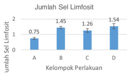
Gambar 1. Grafik rata – rata jumlah sel limfosit pada daerah tarikan ligamen periodontal pada kelompok kontrol 2 minggu (A), kelompok perlakuan kopi 2 minggu (B), kelompok kontrol 3 minggu (C) dan kelompok perlakuan kopi 3 minggu (D).

Pada kelompok kontrol 2 minggu (A) didapatkan rata-rata jumlah sel limfosit adalah 0,75; kelompok perlakuan 2 minggu (B) adalah 1,45; kelompok kontrol 3 minggu (C) adalah 1,26; dan kelompok perlakuan 3 minggu (D) adalah 1,54 (Gambar 1).