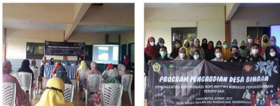
Gambar 3. Kegiatan Sosialisasi

Koordinator Klinik Ekspor Beacukai Jember menyampaikan berbagai contoh kesuksesan ekspor kopi pada komunitas petani di daerah lain. Misalnya komunitas petani di wilayah Aceh yang berhasil mengekspor produk kopi hingga ke manca negara yakni sebanyak 1.065 ton biji kopi arabika gayo pada tahun 2017. Tujuan ekspor kopi gayo antara lain ke Amerika Serikat, Australia, Kanada dan Jerman (Afriamah et al., 2021). Pada masa mendatang, prospek kopi arabika akan semakin menjanjikan karena permintaan global yang semakin meningkat (Alqarni et al., 2020). Berikut dokumentasi kegiatan, seperti terlihat pada Gambar 3.