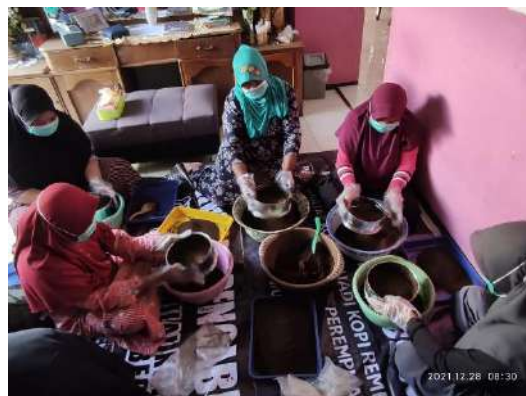
Gambar 4. Kegiatan Produksi KORE

Pada kegiatan ini, komunitas perempuan Desa Tanah Wulan melakukan produksi KORE baik mulai dari persiapan rempah, penyangraian biji kopi, penggilingan biji sangrai, pengayakan kopi bubuk dan formulasi masing-masing varian kopi yakni kopi original, kopi jahe merah, kopi jahe merah dan kapulaga serta kopi jahe merah, kapulaga dan kayu manis. Setiap individu telah menguasai tahapan-tahapan pengolahan KORE sesuai dengan job description masing-masing, seperti terlihat pada Gambar 4.