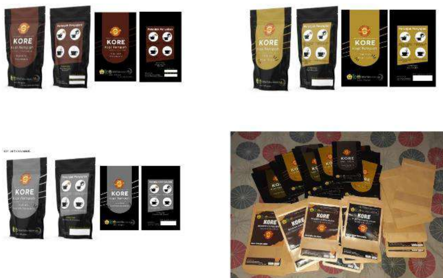
Gambar 6. Inovasi packaging KORE