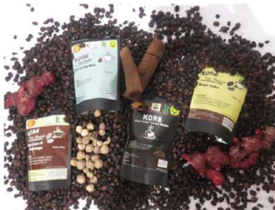
Gambar 5. Varian produk KORE

Adanya kerjasama dengan toko oleh-oleh tersebut meningkatkan jumlah produk KORE yang terjual hingga 50%, disamping penjualan secara langsung maupun menggunakan media sosial dan online market, seperti terlihat pada Gambar 5 dan Gambar 6.