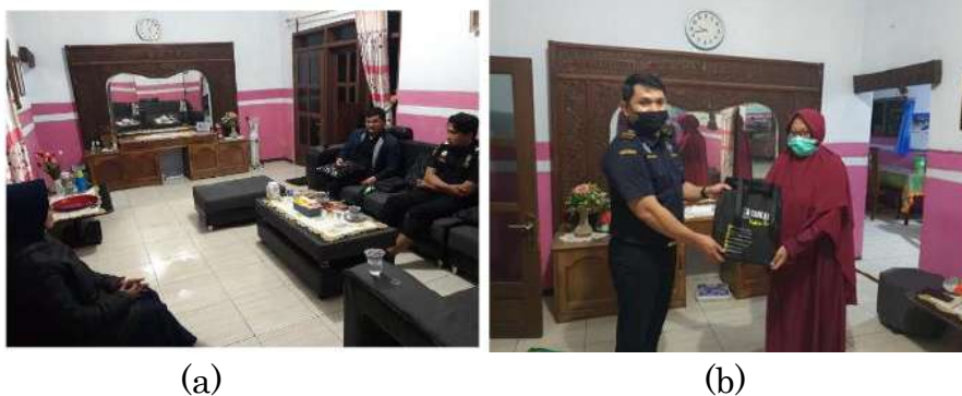
Gambar 2. Diskusi KORE dan Peluang Ekspor (a) Diskusi Pertama (b) Diskusi Kedua

Berdasarkan usaha produksi dan penjualan KORE yang telah kami lakukan sejak tahun 2019, nilai jual kopi robusta yang diproduksi Desa Tanah Wulan dapat memperoleh peningkatan. Selain itu, perempuan di Desa Tanah Wulan juga telah berdaya melalui kegiatan produksi KORE. Pemasaran KORE telah sampai ke Kantor Bea Cukai Jember dan mendapatkan apresiasi yang baik dari Koordinator Klinik Ekspor Bea Cukai (Kepala KPPBC TMP C Jember). Kami menyambung diskusi dan dilakukan pertemuan untuk membicarakan potensi ini yaitu sebanyak dua kali. Dokumentasi pertemuan ini disajikan pada Gambar 2. Terdapat potensi besar KORE bisa diekspor dan beliau siap mendukung dan mentraining kami hingga bisa melaksanakan ekspor. Ada beberapa langkah untuk persiapan ekspor yaitu membentuk koperasi yang berbadan hukum, sertifikasi, dan sebagainya, seperti terlihat pada Gambar 2.