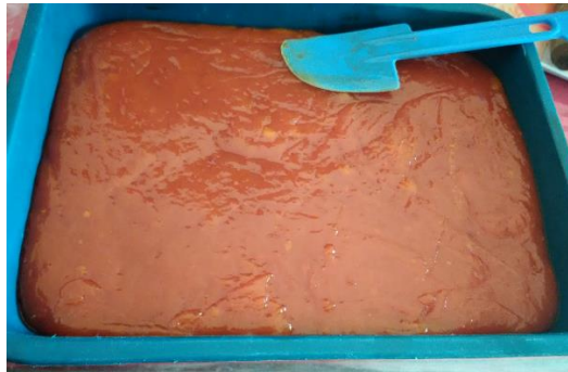
Gambar 14. Adonan yang Telah Dituangkan dalam Baki Plastik

Proses ini dilakukan untuk mempermudah pembentukan dan pendinginan dodol sehingga dapat lebih mudah untuk dicetak. Pencetakan dilakukan dengan cara dipotong-potong sesuai selera setelah dodol mulai mendingin. Proses pendinginan ini dilakukan selama kurang lebih setengah sampai satu jam.