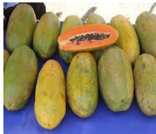
Gambar 6. Buah Pepaya Kalifornia Sebelum di Kupas