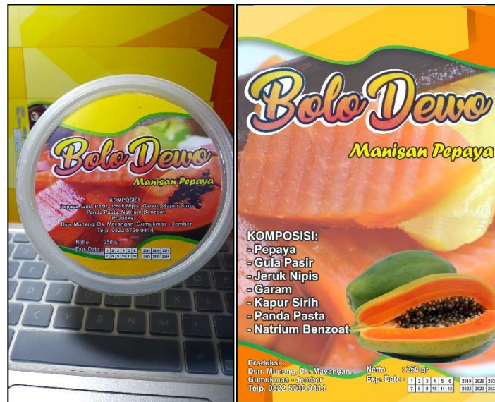
Gambar 6. Branding Manisan Pepaya dalam Cup dan Standing Pot “Bolo Dewo”