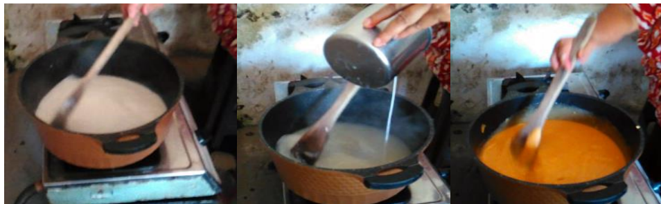
Gambar 11. Pencampuran Bahan-bahan Gula, Garam dan Vanilli