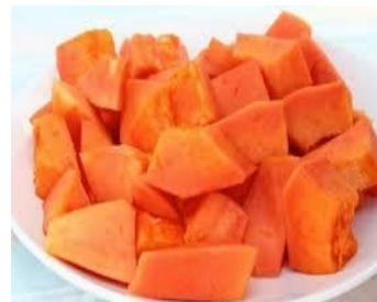
Gambar 7. Pepaya Kalifornia Setelah Dikupas dan Dipotong Dadu