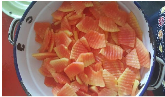
Gambar 2. Buah Pepaya yang Sudah Dipotong dan Ditiriskan

Setiap resep yang terdiri dari \frac{1}{4} kg pepaya kemudian dipotong-potong secara sama rata seperti Gambar 2. Potongan pepaya dibentuk menurut selera, kemudian pepaya direndam dalam larutan kapur sirih selama semalam atau minimal 3 – 4 jam saja sudah cukup. Tiriskan dan cuci pepaya hingga benar-benar bersih, setelah itu keringkan sekitar 10 – 15 menit. Proses pemotongan dilakukan dengan pisau dengan motif seperti gerigi untuk menyamakan potongan pepaya dan agar lebih menarik bentuknya.