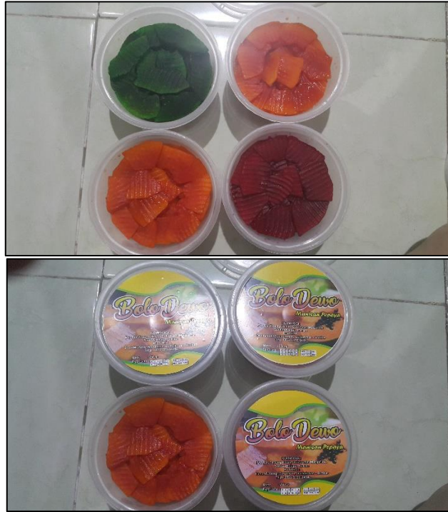
Gambar 5. Pengemasan Manisan dalam Cup Sesuai Warna dan Rasa

Setelah manisan dalam kondisi dingin, barulah dikemas dalam cup. Hal ini dilakukan dengan tujuan untuk menghindari pengembunan pada cup akibat uap panas. Terdapat 4 varian warna dan rasa yaitu pandan (hijau), jeruk (oranye), merah (Strawberry) dan original (warna pepaya murni). Pengemasan masing-masing seberat netto \frac{1}{4} kg. Kemudian untuk menambah cita rasa dan kesegaran manisan, sebaiknya disimpan di dalam kulkas untuk menghasilkan sensasi kesegarannya.