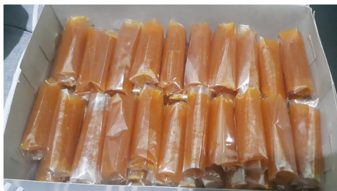
Gambar 15. Pengemasan Dodol Pepaya

Pengemasan ini dilakukan setelah dodol sudah dingin dan sedikit mengeras, sehingga memudahkan pencetakan ke dalam plastik tersebut.