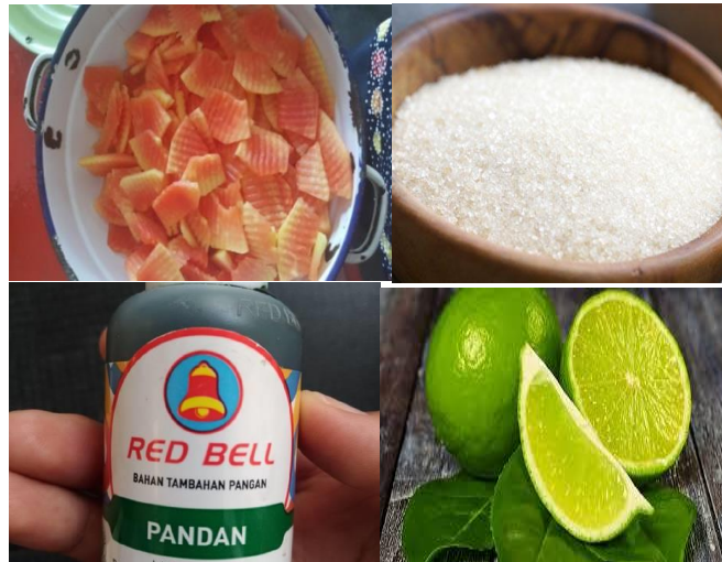
Gambar 1. Bahan-Bahan Pembuatan Manisan Pepaya