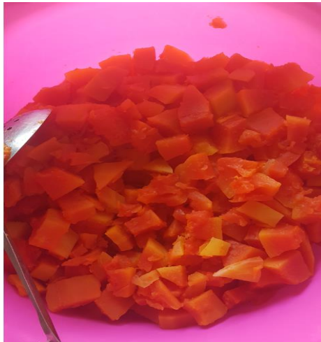
Gambar 8. Potongan Pepaya yang Sudah Dikukus

dihaluskan. Proses pengukusan buah pepaya dilakukan selama 15 – 20 menit dengan api besar. Setelah potongan pepaya selesai dikukus (matang), letakkan ke dalam wadah dan dinginkan terlebih dahulu potongan Pepaya tersebut seperti yang digambarkan dalam Gambar 8.