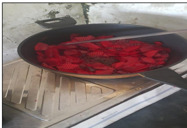
Gambar 4. Manisan yang Sudah Masak dan Diangkat