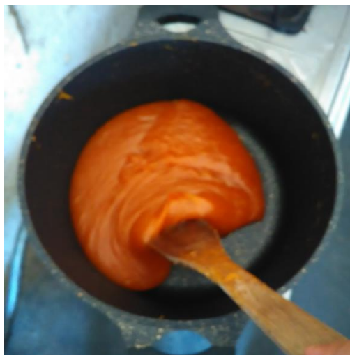
Gambar 13. Adonan yang Sudah mengental dan kalis

Gambar 12 menunjukkan pencampuran margarin pada adonan bubur pepaya ini bertujuan untuk menghindari lengketnya adonan pada wajan, serta untuk menambah kecepatan adonan agar cepat kalis. Setelah adonan dan bahan lain semua tercampur, aduk hingga merata dan adonan mulai mengental dalam jangka waktu 1,5 – 2 jam. Ketika adonan sudah mulai kalis dan mengental akan menunjukkan perubahan warna.