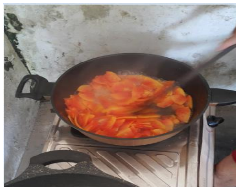
Gambar 3. Proses Pengolahan Manisan Pepaya

Tahapan ini dilakukan dengan cara mencampurkan potongan pepaya yang sudah ditiriskan dan tidak berair, gula pasir, air jeruk nipis.