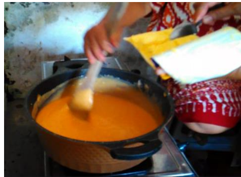
Gambar 12. Campurkan Adonan dengan Margarin secukupnya

Gambar 12 menunjukkan pencampuran margarin pada adonan bubur pepaya ini bertujuan untuk menghindari lengketnya adonan pada wajan, serta untuk menambah kecepatan adonan agar cepat kalis. Setelah adonan dan bahan lain semua tercampur, aduk hingga merata dan adonan mulai mengental dalam jangka waktu 1,5 – 2 jam. Ketika adonan sudah mulai kalis dan mengental akan menunjukkan perubahan warna.