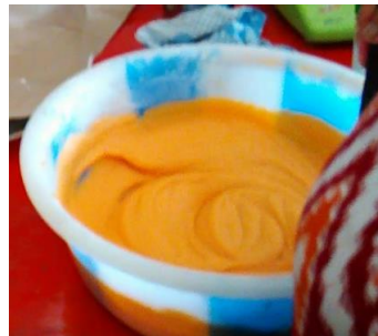
Gambar 10 Bubur Pepaya yang Sudah Dicampur Tepung Ketan

Tahapan selanjutnya setelah Pepaya dihancurkan dan menjadi bubur yaitu masukkan tepung ketan kedalam baskom plastik yang berisi bubur Pepaya kemudian aduk hingga rata seperti yang ditunjukkan dalam Gambar 10. Setelah itu diamkan adonan sampai waktunya untuk dimasukkan ke dalam adonan santan gula, garam dan vanili yang telah mendidih dan mengental.