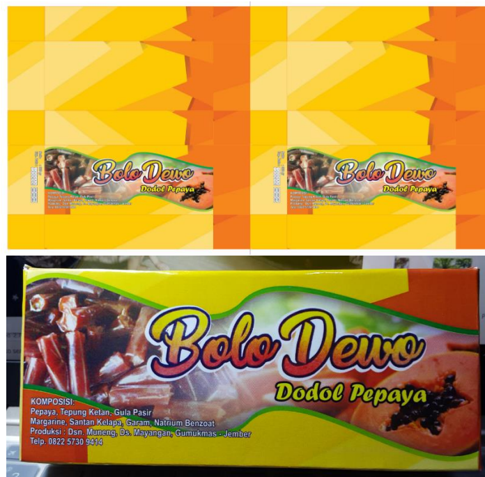
Gambar 16 Kemasan Produk Dodol Pepaya Merek Bolo Dewo

Tahapan terakhir yaitu mengemas dodol pepaya yang telah di dibungkus plastik ke dalam kemasan “Bolo Dewo”, yang dalam kemasan tersebut tertera keterangan produk seperti komposisi, netto produk, komposisi, alamat produksi dan nomor telepon produsen (Gambar 16).