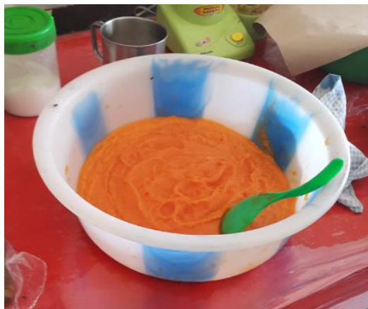
Gambar 9. Bubur Pepaya