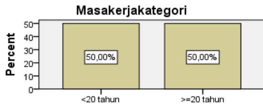
Gambar 3. Karakteristik Sampel Berdasarkan Masa kerja