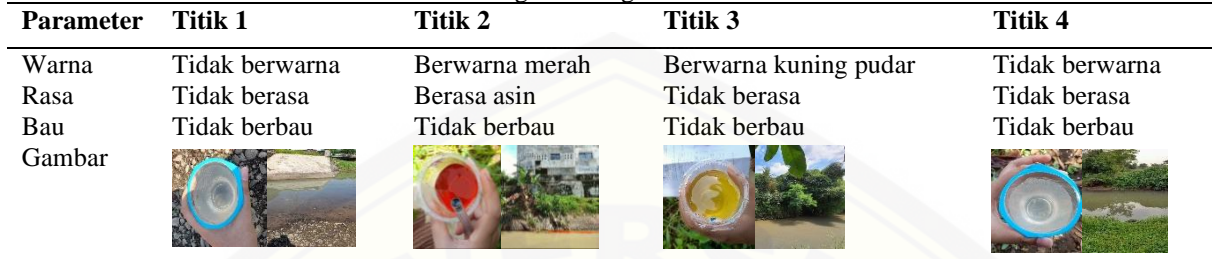
Tabel 2. Hasil Observasi Kondisi Fisik Air Sungai Kreongan

Berdasarkan tabel 2 didapatkan hasil bahwa kondisi fisik air Sungai Kreongan pada titik 1 dan 4 cenderung sama yakni tidak berwarna, tidak berasa dan tidak berbau. titik pembuangan limbah batik. Sedangkan kondisi fisik air Sungai Kreongan pada titik 2 yang merupakan titik point source limbah batik x yakni berwarna merah pada bagian pinggir aliran sungai, berasa asin namun tidak berbau. Warna merah disebabkan dari buangan limbah batik yang mengandung zat warna merah. Hal ini sejalan dengan penelitian Kirana (2021:5) bahwa air Sungai Citarum mengalami perubahan warna menjadi biru akibat buangan limbah pabrik batik yang ada disekitarnya (13) . Warna pada air disebabkan dari adanya bahan kimia atau mikroorganisme yang terlarut dalam air. Warna yang disebabkan dari bahan-bahan kimia disebut apparent color yang berbahaya bagi tubuh manusia (14) .