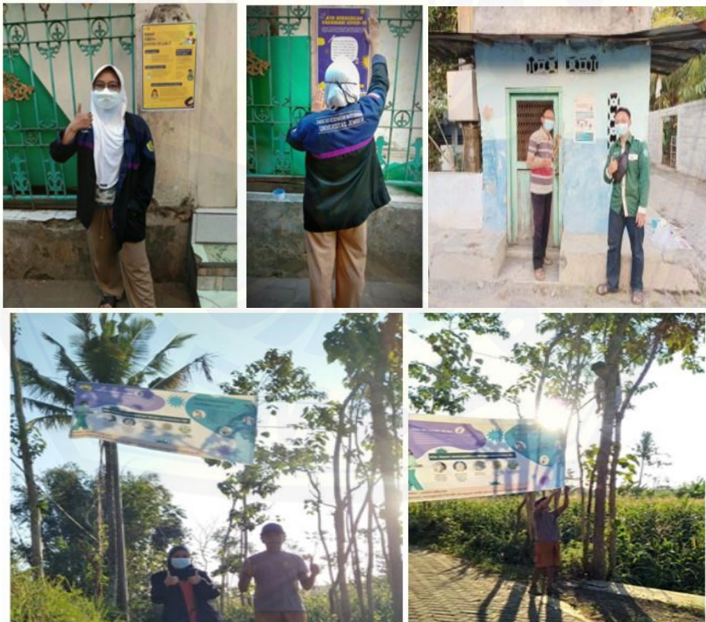
Gambar 2. Edukasi Prokes, pembagian masker dan pemasangan banner