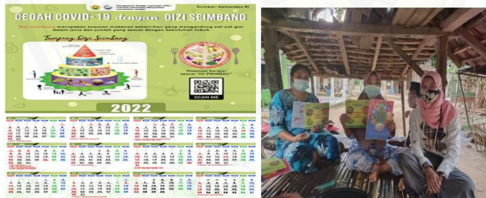
Gambar 1. Edukasi tentang covid-19 dan vaksin

Dalam menghadapi wabah Covid19, diperlukan pengetahuan yang memadai tentang definisi, cara penularan, dan cara penanggulangan. Untuk itu, pemerintah terus menerus memberikan pengetahuan kepada masyarakat melalui berbagai program dalam upaya menekan laju kasus Covid19. Meningkatkan pengetahuan masyarakat bukan hal yang mudah. Perlu edukasi secara berkesinambungan dari berbagai elemen. Salah satu program dari kegiatan pengabdian pada masyarakat ini adalah memberikan berbagai informasi dan pembentukan kader covid19 dimasyarakat agar masyarakat berdaya dalam menghadapi pandemi ini. Salah satu upaya pemerintah dalam menanggulangi wabah Covid19 adalah dengan pemberian vaksin. Pemberian vaksin ini bertujuan untuk membentuk kekebalan tubuh dari serangan virus covid19. Pemahaman masyarakat tentang vaksin sangat beragam. Yaitu antara lain vaksin Covid19 dianggap memiliki resiko, tidak halal, bahkan dianggap dapat dimasuki alat pengintai. Untuk itulah edukasi tentang Covid19 dan vaksin perlu dilakukan. Kegiatan ini dimulai dengan dilakukan pre test , edukasi berupa penyuluhan dan pelatihan, tanya jawab dan post test . Masyarakat dan kader sangat antusias dalam mengikuti kegiatan ini. Untuk membantu pemahaman masyarakat terkait materi yang disampaikan digunakan media yang menarik dan bergambar baik dalam bentuk poster maupun power point bersuara (Gambar. 1)